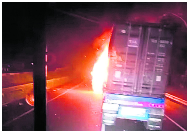
El tractocamión, que transportaba un cargamento de electrodomésticos con destino al municipio de Yumbo, fue interceptado por hombres armados en el sector Bendiciones.

Durante el recorrido fue interceptado por varios hombres armados, quienes obligaron al conductor a detener la marcha y posteriormente