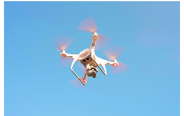
Militares denuncian que algunos pelotones han recurrido a colectas voluntarias para comprar drones comerciales.

Luego de las denuncias hechas por militares en el departamento del Cauca en las que se refieren a que hacen "vaca" para comprar drones para poder hacer frente al conflicto armado en esta región, el Ejército respondió que la decisión de los uniformados es personal y no institucional.