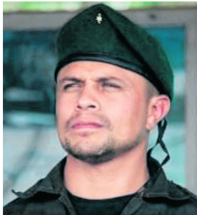
Las Fuerzas Militares mantienen operaciones de inteligencia y la búsqueda del cuerpo de alias "Marlon".

De acuerdo con el general López, análisis espectrográficos y de forma de onda realizados por especialistas evidenciaron inconsistencias, alteraciones digitales y