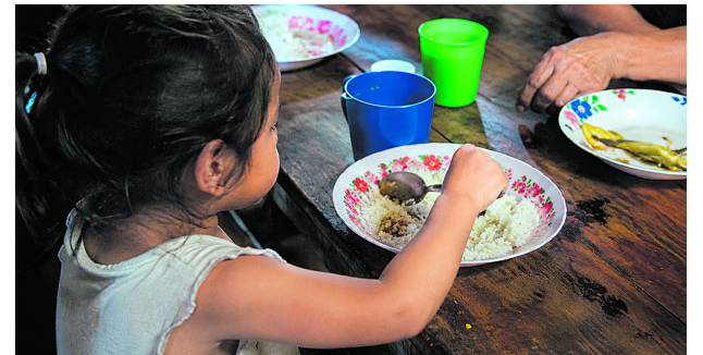
Alimentación suficiente en Cali sigue siendo un desafío para miles de hogares.

Cerca de 192 mil personas en Cali enfrentan dificultades para acceder a una alimentación suficiente, según los resultados de la Encuesta de Percepción Ciudadana 2025, presentada por Cali Cómo Vamos en alianza con la Fundación SIDOC, a través del programa Futuros Urbanos Cali. La medición expone cómo se alimentan los hogares caleños, las principales barreras para acceder a alimentos y los hábitos de consumo que predominan en la ciudad.