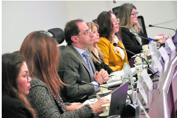
José Manuel Restrepo participó en la instalación del Comité de Empalme Anticorrupción de la Patria Milagro.

El vicepresidente electo señaló que la transparencia y la verdad serán principios fundamentales durante el empalme. También afirmó que, si durante la revisión de la información se detectan irregularidades o situaciones que generen alertas, estas serán puestas en conocimiento de las autoridades competentes. Agregó que el objetivo es contar con los elementos necesarios para adoptar decisiones estratégicas durante el nuevo