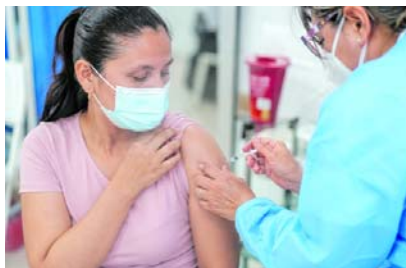
Autoridades recomiendan completar la vacunación contra el sarampión antes de viajar al Mundial 2026.

El Ministerio de Salud y Protección Social informó que durante junio reforzará las acciones de vacunación y vigilancia epidemiológica con el fin de prevenir la reintroducción del virus en Colombia. La entidad recordó que el sarampión es una enfermedad altamente contagiosa que puede generar complicaciones de salud y afectar principalmente a menores de cinco años y a personas que no cuentan con inmunización.