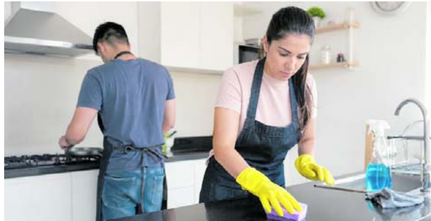
Encuesta Nacional de Uso del Tiempo revela diferencias entre hombres y mujeres.

Para este estudio, el Dane tuvo en cuenta a 44,014 millones de personas de 10 años y más en todo el país, de las