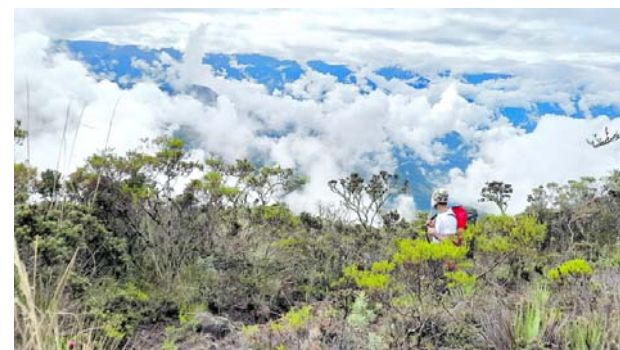
Investigadores encontraron microorganismos claves para la restauración ambiental y el desarrollo biotecnológico.

En Palmira, la corporación destacó la actuación de trabajadores de una granja avícola que ahuyentaron un puma sin causarle daño. La CVC explicó que estos animales pueden acercarse a zonas productivas cuando disminuyen sus presas naturales