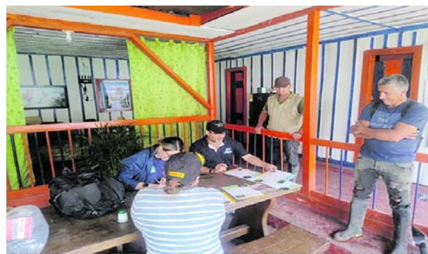
La CVC adelanta jornadas de sensibilización y entrega recomendaciones a comunidades rurales para promover la coexistencia segura con el puma y proteger el equilibrio de los ecosistemas del Valle del Cauca.

A través de su equipo de respuesta a la coexistencia con animales silvestres y de la Dirección Ambiental Regional BRUT, la entidad ha desarrollado reuniones con comunidades y autoridades locales para explicar la importancia ecológica de estos grandes felinos y evitar reacciones que