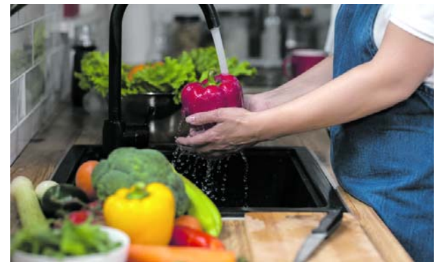
Los alimentos insalubres representan un mayor riesgo para los niños pequeños.

Por otro lado, el trabajo no remunerado presentó una tendencia opuesta. Este grupo incluye actividades domésticas y de cuidado dentro de los hogares.