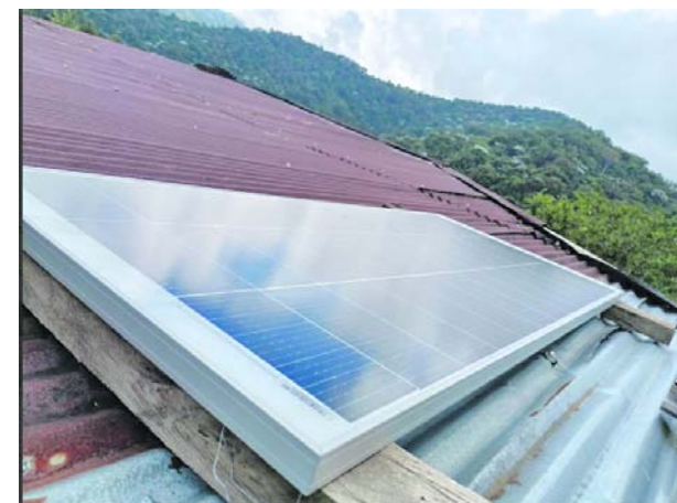
Los sistemas fotovoltaicos instalados por la CVC llevan energía limpia a familias rurales del Valle.

Estudios anteriores asociaron la exposición crónica a estos compuestos con cambios fisiológicos y deficiencias de clorofila en manglares.