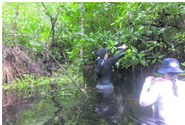
Raíces de mangle rojo en la bahía de Cispatá y la Ciénaga Grande de Santa Marta revelan la presencia de contaminantes.

Las muestras fueron examinadas mediante cromatografía de gases acoplada a espectrometría de masas (GC-MS), técnica que permitió