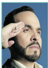
Abelardo De la Espriella

El candidato presidencial Abelardo de la Espriella quedó revestido del aura del ganador. Luego de imponerse en la primera vuelta y convertirse en el candidato más votado en una primera vuelta presidencial en la historia de Colombia –con 10.361.499 votos–, el abogado comenzó a atraer, como un imán, adhesiones y respaldos a lo largo y ancho del país. Y eso ocurre pese a que el propio candidato ha sido enfático desde el comienzo en rechazar el respaldo formal de partidos políticos y en mantener distancia frente a la política tradicional.