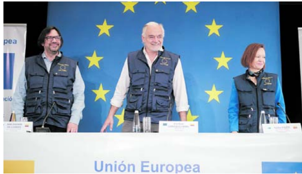
La MOE UE respaldó la transparencia del sistema electoral colombiano.

En su declaración, presentada este 2 de junio, la misión internacional señaló que la jornada electoral transcurrió de