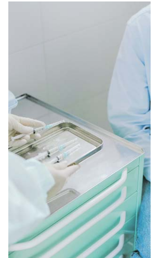
Miles de pacientes con enfermedades crónicas afiliados a Emssanar en Buenaventura, Palmira, Buga, Candelaria y El Cerrito quedaron a la espera de una solución que garantice la continuidad de sus tratamientos.

La situación se suma a las dificultades que enfrenta la red de atención en el departamento y profundiza las barreras de acceso a los servicios de salud, especialmente para pacientes que requieren controles, medicamentos y procedimientos especializados de manera continua. El impacto es aún mayor en municipios como Buga, donde la suspensión se agrega a las dificultades que ya afectan la prestación de servicios en dis-