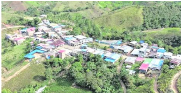
Un artefacto explosivo cayó en el sector de La Betulia, zona rural de Suárez, Cauca, dejando ocho personas heridas, mientras cerca de 200 familias permanecen confinadas por los enfrentamientos.

Entre los afectados se encuentran un niño de 5 años, un niño de 7 años, un niño de 9 años, dos niñas de 9 años, una adolescente de 12 años y un