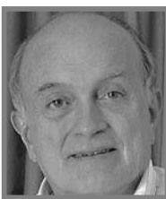
GUSTAVO ALVAREZ GARDEAZÁBAL

El antiguo Caldas ha tenido vida propia con éxitos o sin ellos. A un ritmo que otras regiones del país no han ni siquiera imitado, con premura pero con atrevimiento, pasó de ser tierra colonizable por paisas a gran territorio cafetero. Por vicios hispano católicos arraigados en esas breñas difíciles, alentaron el surgimiento de tres ciudades que aspiraban a ser sedes episcopales para tener cada una su catedral, su aeropuerto y su estación del tren. Hoy son tres departamentos que dejaron de competir y prefieren repartirse los dineros que otorga el turismo o las fábricas con que han ido reemplazando las matas de café. Los une la carretera de doble calzada que baja de Manizales a Pereira y Armenia y los interconecta con el Valle, Antioquia y Bogotá. Hasta ahora fue tan bien mantenida que resultó exageradamente rentable pero como fue construida por el sis-