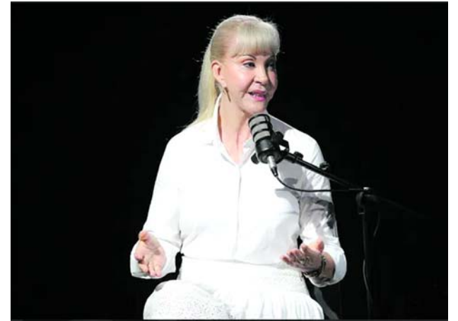
La gobernadora del Valle del Cauca, Dilian Francisca Toro, cuestionó los diálogos con estructuras criminales.

De forma simultánea, el segundo vehículo fue interceptado y su conductor intentó huir hacia una zona boscosa, donde posteriormente fue ubi-