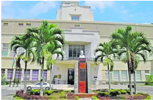
La Gobernación del Valle alertó que la falta de pagos a las EPS intervenidas podría provocar el cierre de servicios y agravar las barreras de acceso a la atención en salud para miles de usuarios del departamento.

De acuerdo con el comunicado, de los 789 mil millones de pesos correspondientes al giro mensual de la Unidad de Pago por Capitación (UPC) de los regímenes subsidiado y contributivo, únicamente se han desembolsado 289.398 millones