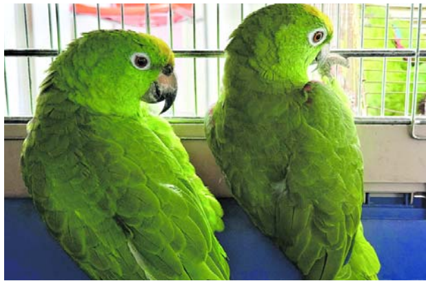
Cinco aves silvestres recuperadas por la CVC iniciaron evaluación para posible liberación.

Según la institución, el objetivo consiste en acercar los servicios policiales a la comu-