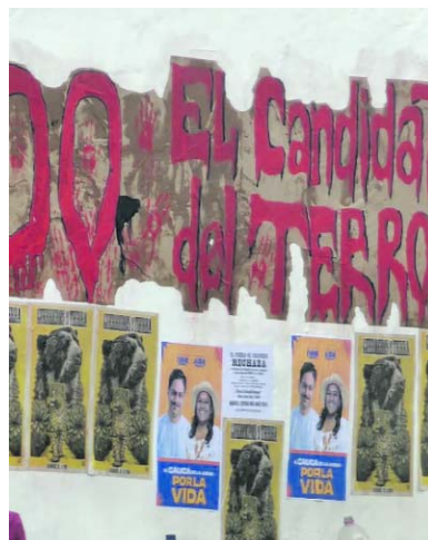
La fachada de la iglesia Santo Domingo, uno de los principales referentes patrimoniales de Popayán, fue nuevamente afectada por grafitis y mensajes que generaron rechazo entre la comunidad.

La comunidad también recordó que no es la primera vez que la iglesia Santo Domingo resulta afectada por actos de vandalismo. Por ello, pidió a las autoridades adelantar las investigaciones correspondientes, identificar a los responsables y garantizar la recuperación de la