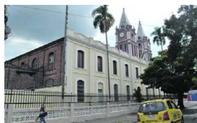
Hasta el 30 de junio se prolongarán las medidas de seguridad adoptadas por la Alcaldía de Tuluá.

Las autoridades aclararon que la circulación de motocicletas y el uso de par-