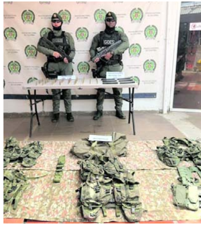
Material incautado durante operación en zona rural de Dagua.

La operación se desarrolló sobre la vía que conduce al corregimiento de Santa María, donde fueron hallados un artefacto explosivo improvisado tipo granada de mortero, una granada tipo tubo Bangalore, seis chalecos portaproveedores pixelados, sesenta y cinco cartuchos calibre 5.56, seis proveedores para este mismo