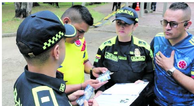
La línea cortafuegos en Cristo Rey alcanza 3,8 kilómetros de extensión.

idad mediante una plataforma de fácil acceso que permita una comunicación más directa entre los ciudadanos y las diferentes unidades encargadas de atender situaciones