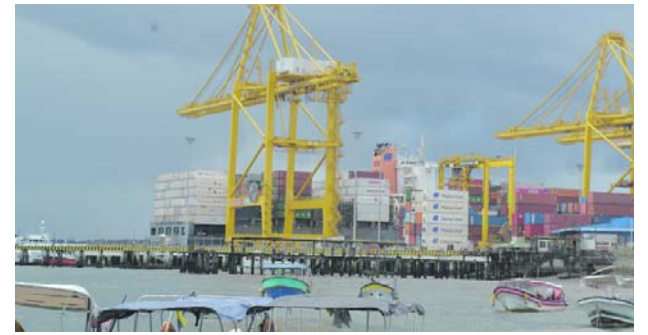
Gremios de Buenaventura están a la expectativa por el nuevo gobierno.

Adicionalmente, se suspendió la expedición de nuevos permisos para eventos de aglomeración compleja y se restringió la realización de caravanas y actividades masivas de carácter cultural, artístico, religioso, deportivo o político durante la vigencia del decreto.