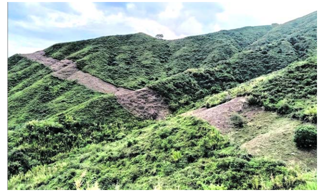
La línea cortafuegos en Cristo Rey alcanza 3,8 kilómetros de extensión.

De acuerdo con la autoridad ambiental, los animales que han permanecido durante largos periodos en cautiverio requieren atención especializada antes de ser considerados para una eventual liberación. Este procedimiento forma parte de los protocolos aplicados por la entidad para garantizar el bienestar de los ejemplares recuperados.