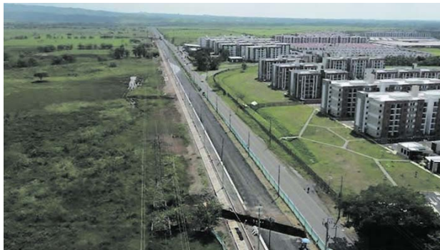
La gobernadora del Valle, Dilian Francisca Toro, realizó un sobrevuelo a las obras de la Avenida Cañasgordas.

La mandataria realizó un sobrevuelo entre Cali y Jamundí e inspeccionó el avance de la segunda calzada de la Avenida Cañasgordas, una de las obras de infraestructura más importantes para la movilidad del sur del Valle del Cauca, que ya supera el 60 por ciento de construcción, una cifra que duplica lo proyectado para esta etapa.