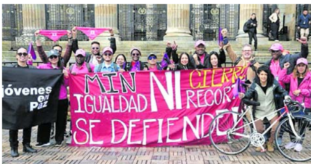
Funcionarios del Ministerio de la Igualdad expresaron su preocupación tras el inicio del proceso de liquidación y ante la incertidumbre sobre su situación laboral.

so, término que podrá ser prorrogado por el Gobierno.