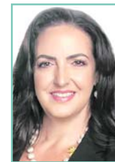
María Fernanda Cabal