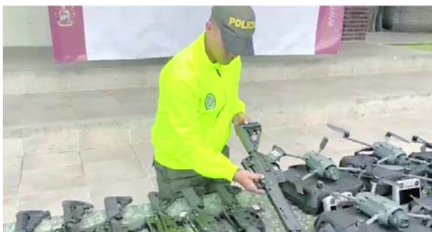
Material de guerra incautado en Yumbo, entre el que se encontraban fusiles, minas antipersonal, munición y drones.