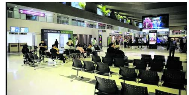
Nuevas rutas aéreas fueron puestas al servicio de los vallecaucanos.

Así lo dio a conocer la secretaria de Turismo del Valle, Miyerlandi Torres, quien destacó las nuevas opciones disponibles para quienes deseen visitar la región.