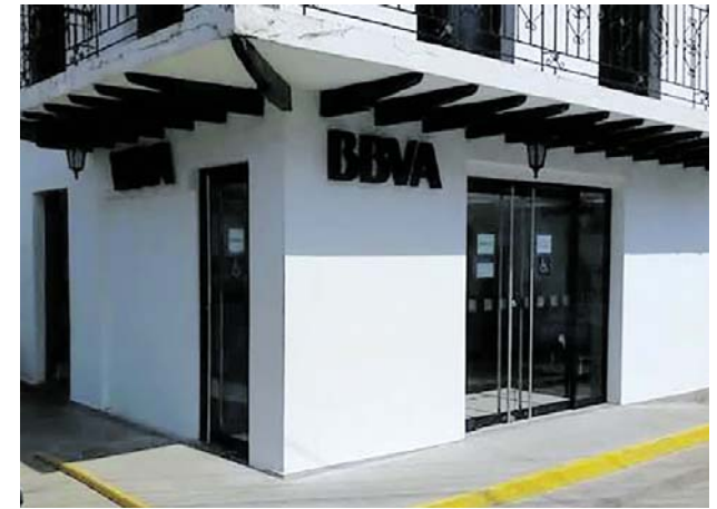
Las autoridades inspeccionan la sede del banco BBVA en Caloto, donde un boquete en una pared habría permitido el ingreso de los delincuentes hasta la bóveda de la entidad financiera.

Así mismo, el Puesto de Mando Unificado (PMU) seguirá activo y continuará la distribución de agua potable mediante carrotaques en los sectores que aún lo requieran, hasta garantizar que el servicio llegue de manera estable y completa a todos los hogares bonaverenses.