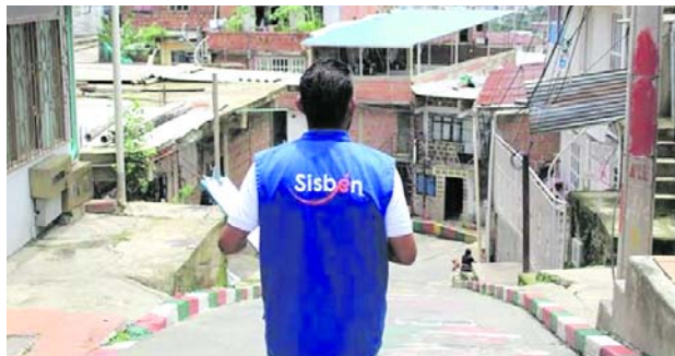
Registratón facilitará la solicitud de la encuesta Sisbén en Cali.

jornadas descentralizadas en diferentes zonas de Cali.