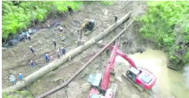
Tras la reparación de la tubería principal de conducción, Buenaventura inició el restablecimiento gradual del servicio de agua potable, mientras continúan las acciones de apoyo y monitoreo por parte de la Gobernación del Valle del Cauca.

De acuerdo con el reporte oficial, tropas del Batallón de Despliegue Rápido N.º 15 ubicaron el cargamento en el Centro Nacional de Carga de Yumbo, tras labores de inteligencia desarrolladas en los departamentos del Valle del