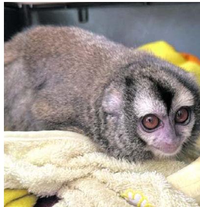
Mono nocturno y guacamaya fueron rescatados tras permanecer tres años en cautiverio.

Al llegar al inmueble, ubicado en Guadalajara de Buga, los funcionarios encontraron al primate. Sin embargo, durante la inspección escucharon el fuerte llamado de una guacamaya que permanecía en la terraza de la vivienda. El