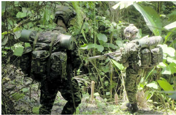
Autoridades regionales pidieron mantener los operativos en el suroccidente colombiano.

De acuerdo con la información conocida, la operación también dejó otros integrantes de la estructura armada abatidos y las tropas continúan desplegadas en el área.