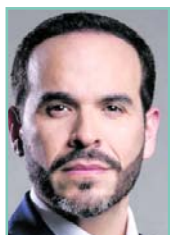
Abelardo De la Espriella.

La elección de Abelardo de la Espriella como presidente de Colombia no surgió de la nada. Por el contrario, fue el resultado de una lectura política que pocos hicieron y que comenzó a manifestarse desde las elecciones presidenciales de 2022.