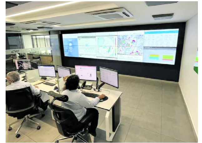
Desde el centro de monitoreo de la CVC se realiza seguimiento permanente a las condiciones climáticas e hídricas de la región.

Así mismo, aconsejó no usar drones ni reproducir cantos de aves, evitar grupos numerosos, no manipular huevos o polluelos y no arrojar basura.