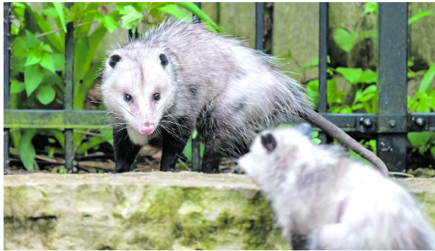
Las zarigüeyas son animales solitarios y existen protocolos de protección para su manejo.

La iniciativa busca acercar a la ciudadanía al conocimiento de esta especie, que en los últimos años ha incrementado su presencia en zonas urbanas