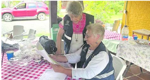
Juntas de acción comunal realizan empalme antes del inicio del periodo 2026-2030.

Este proceso permite que los nuevos dignatarios conozcan el estado administrativo, financiero y legal de las organizaciones comunitarias. Además, facilita la continuidad de los planes, programas y proyectos que se encuentran en ejecución o en trámite