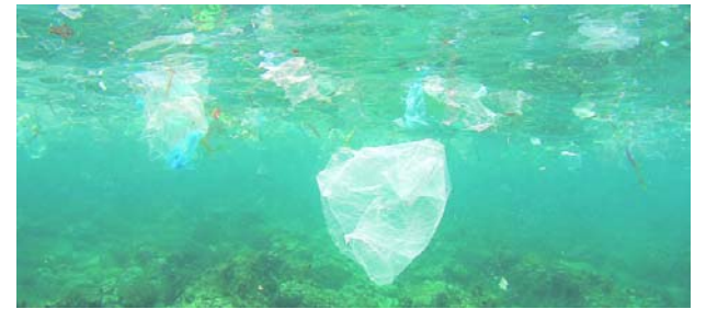
Residuos plásticos y microplásticos continúan acumulándose en los océanos de todo el mundo.

La primera fase corresponde a la etapa preparatoria. En ella se conforma un equipo de trabajo liderado por la junta directiva, con acompañamiento del fiscal de la junta de acción comunal.