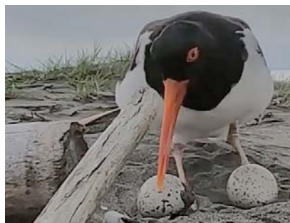
Por esta época las aves playeras llegan a las playas del Pacífico y el Caribe a reproducirse.

Aunque enfrentan amenazas naturales como inundaciones, tormentas y