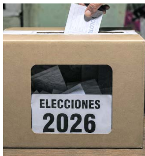
Habitantes de zonas rurales de Nariño, Huila y Antioquia han denunciado presiones, amenazas y restricciones impuestas por grupos armados ilegales en vísperas de la jornada electoral del 21 de junio de 2026.

recientemente, un presunto cabecilla del grupo armado señala que desde el jueves pre-