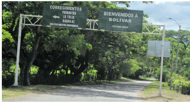
Bolívar es uno de los municipios que estará bajo vigilancia especial durante las elecciones presidenciales.

dores que conectan el norte del Cauca con el sur del Valle, zonas donde persisten disputas por el control de rutas estratégicas y economías ilícitas.