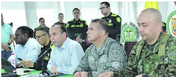
Cali desplegará 4000 policías durante la jornada electoral del 21 de junio.

autoridades locales trabajarán de manera articulada para hacer seguimiento permanente a los diferentes eventos que puedan presentarse en la ciudad. El alcalde Alejandro Eder invitó a los ciudadanos a acudir a las urnas con tran-