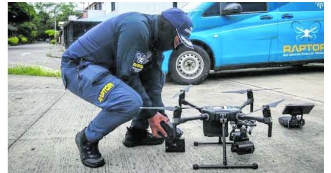
Seguridad electoral en el Valle contará con monitoreo aéreo y más de 11.500 uniformados.

Uno de los principales anuncios corresponde al refuerzo de la presencia policial en Cali. De acuerdo con la Policía Metropolitana, un total de 4000 uniformados estarán dedicados exclusivamente a la seguridad durante las elecciones. Esta cifra incluye la llegada de 1000 policías adicionales enviados por la Policía Nacional para fortalecer las labores de vigilancia, prevención y reacción en diferentes sectores de la ciudad.