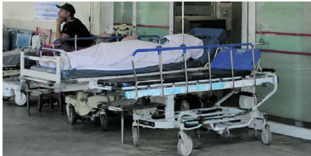
La crisis humanitaria en salud sigue vigente en los 40 municipios del Valle del Cauca.

La mandataria indicó que las condiciones que motivaron la declaratoria de crisis siguen presentes y aseguró que numerosos pacientes encuentran barreras dentro del sis-