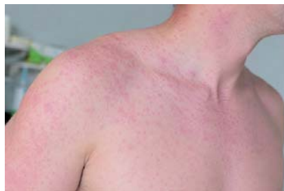
Revise su vacunación contra el sarampión antes de viajar. Conozca las recomendaciones de la OPS y la OMS.

La recomendación surge en medio de los rebotes de sarampión registrados en las Américas, una situación que mantiene la atención de las autoridades sanitarias debido a la capacidad de propagación de esta enfermedad. Según la información difundida por los organismos internacionales, una sola persona infectada puede