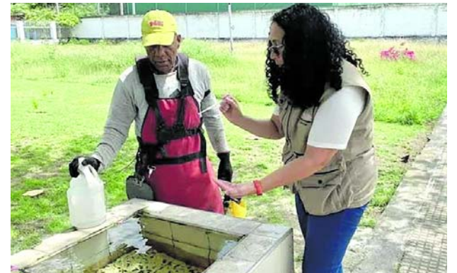
Las autoridades de salud intensifican las acciones de prevención y control de criaderos del mosquito Aedes aegypti para reducir los casos de dengue en el Valle del Cauca

Para responder a los riesgos identificados, el Gobierno Nacional, la Gobernación del Valle y las autoridades militares y policiales desplegaron un operativo de más de 11.500 integrantes de la Fuerza Pública.