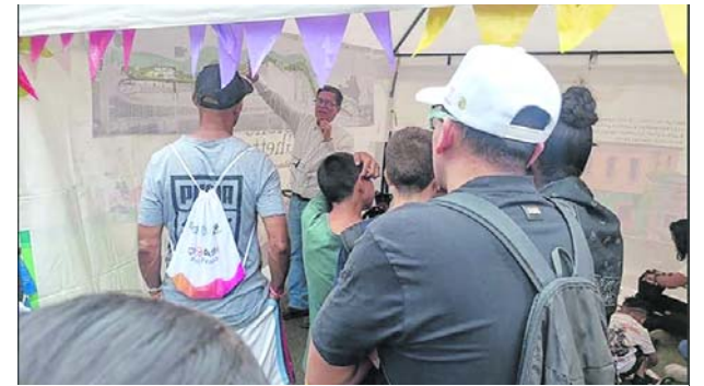
Corredor Ambiental Jarillón del Río Cauca contempla parque lineal, senderos y ciclorrutas.

La gobernadora explicó que este proceso debe priorizar la articulación de la red pública y garantizar la complementariedad de la red privada, de manera organizada y acorde con la estructura de salud existente en el departamento. El objetivo, según indicó, es fortalecer la capacidad de respuesta del sistema y facilitar el acceso de los pacientes a los servicios requeridos.