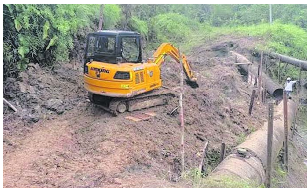
Maquinaria pesada y operarios trabajan en el sector de El Venado para llegar al punto de la emergencia y reparar la tubería que abastece de agua a Buenaventura.