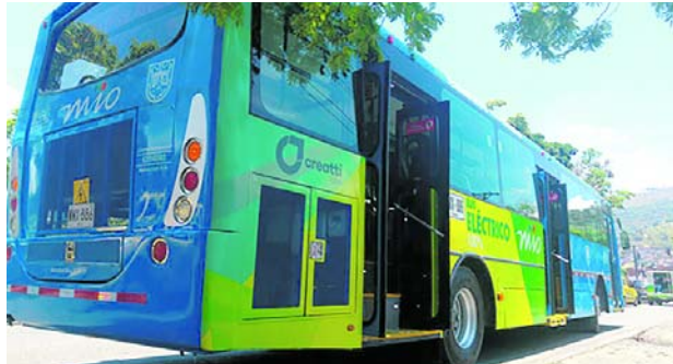
Capturan a dos personas por ataque contra un bus del MÍO en Potrero Grande.