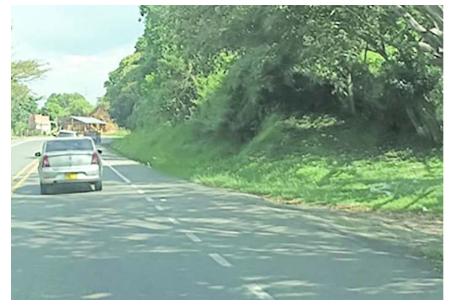
El reciente ataque armado contra el alcalde de Buenos Aires, Cauca, y otros hechos de inseguridad reavivaron el llamado de gremios y autoridades para reforzar la presencia militar en la vía Panamericana.

Transportadores y sectores productivos consideran que estos casos reflejan la necesidad de fortalecer la seguridad en un corredor clave para la movilidad y el comercio del sur del país.