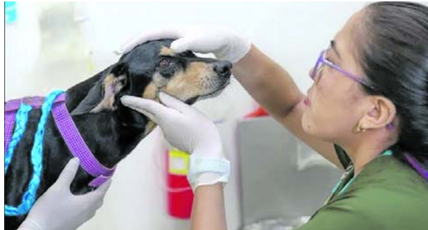
El moquillo canino puede prevenirse con vacunas y refuerzos oportunos.

La Unidad Administrativa Especial de Protección Animal (Uaepa) advirtió que esta enfermedad viral afecta principalmente a pacientes juveniles que no cuentan con esquemas completos de vacunación o no desarrollaron títulos sufi-