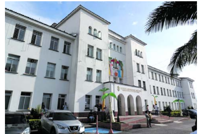
Pacientes y personal médico enfrentan una fuerte presión asistencial por la sobreocupación registrada en los hospitales San José y Susana López de Valencia de Popayán.

Ante esta situación, unidades de la Estación de Guardacostas de Buenaventura desplegaron labores de vigilancia y reconocimiento apoyadas por un sistema aéreo no tripulado, lo que permitió ubicar a las personas retenidas en el estero Santa Delicia.