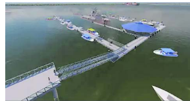
El nuevo embarcadero turístico de Buenaventura presenta un avance del 95%, pero su entrada en operación depende de la autorización para retirar el antiguo muelle flotante que permanece en el lugar.

De acuerdo con el Gobierno nacional, la meta es restablecer el servicio de acueducto el próximo 20 de junio, una vez concluyan las obras de reparación y se normalice el suministro de agua en la ciudad.