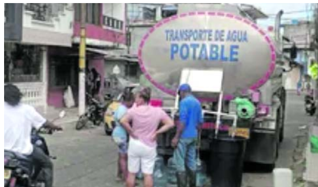
Con carrotaques se abastece de agua potable la ciudadanía de Buenaventura.

Ministerio de Educación acompaña la atención domiciliaria de los estudiantes y garantizará la continuidad del Programa de Alimentación Escolar (PAE) mediante la entrega de apoyos alimentarios en los hogares.