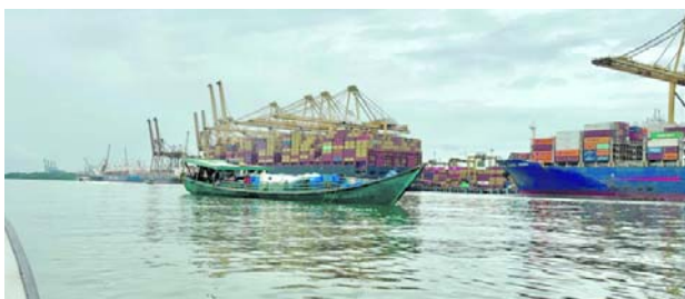
Las ocho personas liberadas, entre ellas un menor de edad, fueron ubicadas por unidades de la Armada de Colombia en el estero Santa Delicia, tras una operación coordinada con el CTI de la Fiscalía en Buenaventura.