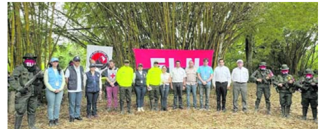
Liberación de los agentes de la Dijín tras cerca de 11 meses de secuestro en Arauca.

Uno de los aspectos que más preocupa a las autoridades es el comportamiento de las temperaturas. Santa Marta registró máximas de 37,2 grados centígrados, una cifra cercana a cuatro grados por encima del promedio histórico de la ciudad.