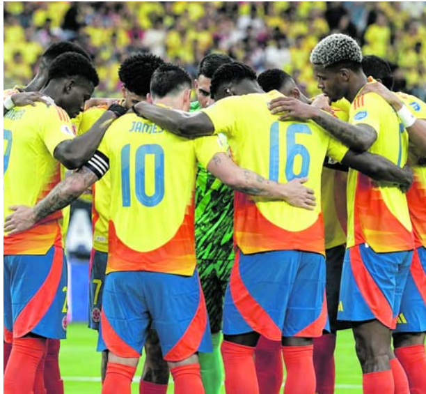
Selección Colombia vs Uzbekistán abre el camino de la Tricolor en el Mundial 2026.

Colombia llega respaldada por un proceso que la ubicó entre las selecciones protagonistas del continente y con la intención de trasladar ese rendimiento al escenario mundialista.