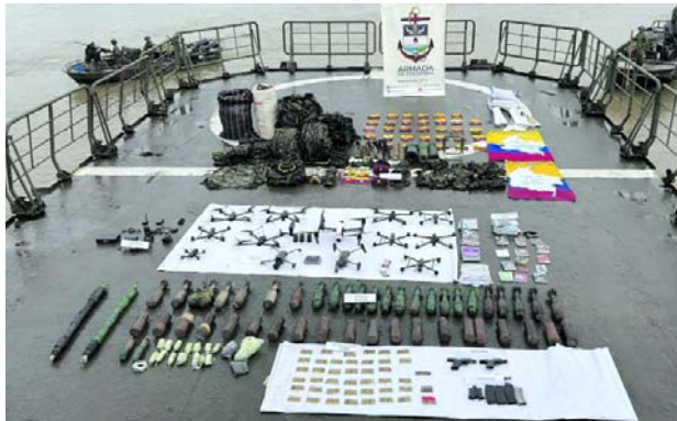
Material de guerra, explosivos, equipos de comunicación y 13 drones fueron hallados por las Fuerzas Militares durante una operación conjunta en el río Micay.

Según la información oficial, unidades del Batallón Fluvial de Infantería de Marina No. 42 sostuvieron un com-