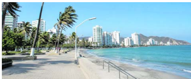
Santa Marta declaró calamidad pública por el fenómeno de El Niño ante la crisis hídrica.

Con esta declaratoria, las autoridades podrán poner en marcha herramientas admi-