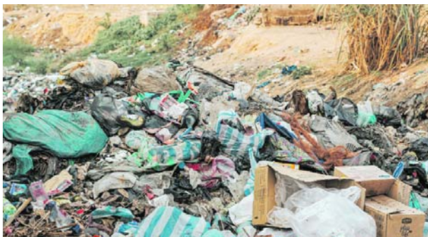
Autoridades judiciales realizaron la inspección técnica del cuerpo hallado en una estación de transferencia de residuos ubicada en la vía Palmaseca-Rozo, en jurisdicción de Palmira.

Según el informe oficial, el hallazgo se produjo durante un procedimiento de transferencia de residuos. En medio de las labores operativas, un tra-