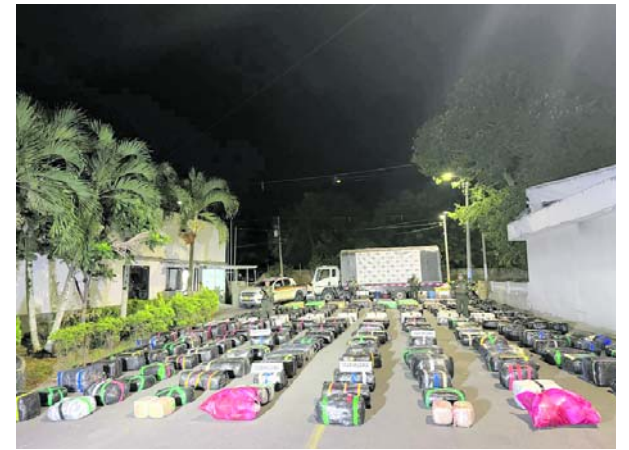
La Policía Nacional incautó 5.545 kilogramos de marihuana tipo “creepy” durante un operativo de control vial en la vía Villa Rica-Palmira, Valle del Cauca.

El directivo explicó que la falta de recursos ha generado dificultades para cumplir con obligaciones fundamentales de la institución, entre ellas el pago a proveedores, la adquisición de medicamentos y la contratación de personal de salud.