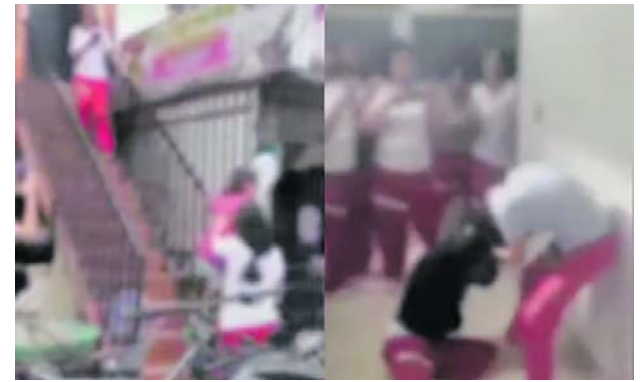
Autoridades e instituciones reaccionan ante las riñas en colegios de Cali. Antetítulo: Señales de una problemática mayor.

La propuesta invita a mantener la consistencia, es decir, consumir un solo tipo de licor; contar con un conductor elegido para evitar manejar bajo efectos del alcohol; permanecer en compañía de personas de confianza; regular la cantidad y el tiempo de consumo; verificar la calidad de las bebidas; promover la resolución pacífica de conflictos; utilizar preservativos para prevenir infecciones de transmisión sexual y embarazos no deseados; y alimentarse antes, durante y después de la ingesta de alcohol.