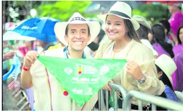
La campaña promueve el consumo responsable de licor durante el Mundial 2026.

La estrategia se desarrollará en el marco de la Política Distrital de Salud Mental y contará con la participación del personal psicosocial del programa de salud mental y convivencia. Estos equipos estarán presentes en algunos de los espacios habilitados para que los ciudadanos dis-