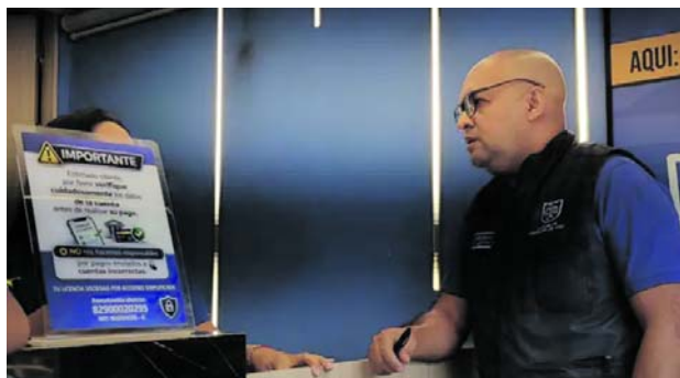
Autoridades alertan sobre irregularidades en licencias de conducción y publicidad engañosa.

mente por los canales oficiales y confirmar cualquier información directamente con la Secretaría de Movilidad y la Administración