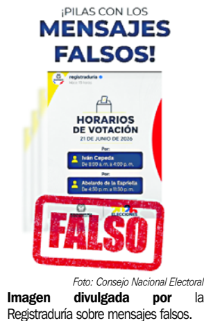
Imagen divulgada por la Registraduría sobre mensajes falsos.

En los últimos días circularon en redes sociales y aplicaciones de mensajería imágenes que atribuían a la Registraduría supuestos cambios en la jornada electoral. Algunas de esas publicaciones aseguraban que los ciudadanos debían acudir a las