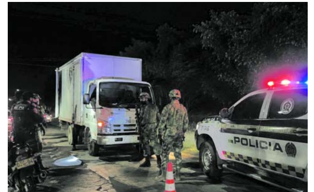
Tiroteo en Sameco frustró el ingreso de cocaína a Cali durante un operativo.

"Basta de miedo, pueblo caleño. Es hora de rebelarse contra el odio, contra el caos, contra la división y contra el tirano que ya prepara otro estallido social para sepultar la democracia", manifestó.