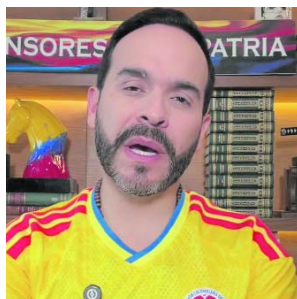
Abelardo de la Espriella habló de Cali y anunció cierre de campaña en Buga

El candidato presidencial Abelardo de la Espriella realizó una transmisión en vivo a través de su cuenta de YouTube en la que abordó diferentes asuntos relacionados con la coyuntura política del país. En medio de su intervención, dedicó varios minutos a referirse al Valle del Cauca, especialmente a Cali, ciudad sobre la que expresó preocupaciones frente al ambiente previo a la segunda vuelta presidencial. Además, anunció que el cierre de su campaña se llevará a cabo