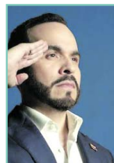
Abelardo De la Espriella

Las votaciones de Gustavo Petro en la primera vuelta de 2022 y de Iván Cepeda en la primera vuelta de 2026 en este departamento tienen una coincidencia casi exacta. Petro obtuvo el 53,34% de los votos depositados en el Valle del Cauca en 2022 y Cepeda alcanzó ahora el 53,17%. Prácticamente lo mismo.