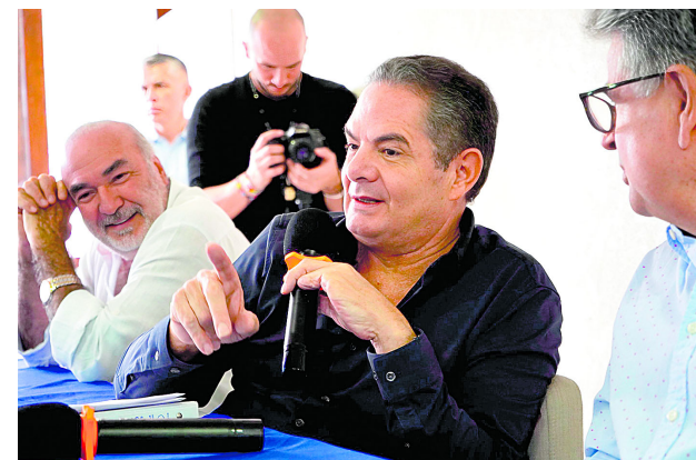
Germán Vargas Lleras murió en Bogotá a los 64 años tras enfrentar un cáncer y complicaciones neurológicas.

La trayectoria de Vargas Lleras también estuvo marcada por hechos violentos. En 2002 sufrió un atentado con un libro bomba que le dejó graves heridas en las manos y el ros-