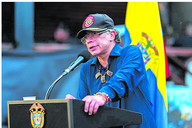
Gobierno Petro solicitó suspender órdenes contra cabecillas del Clan del Golfo por paz total.

La Resolución 120 establece que la Oficina del Alto Comisionado para la Paz comunicó oficialmente la decisión a las autoridades competentes, incluida la Fiscalía General de la Nación. El documento argumenta que la medida se sustenta en disposiciones de la Ley 418, relacionada con procesos de paz y sometimiento.