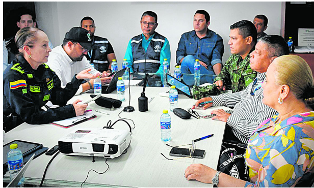
Autoridades locales , Fuerza Pública y organismos de seguridad participaron en el consejo de seguridad realizado en Obando tras el asesinato de la presidenta del Concejo.