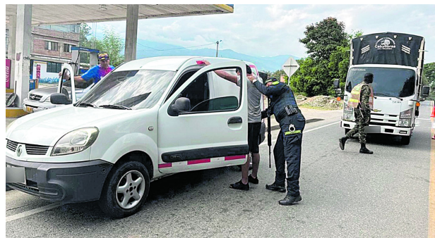
Las autoridades del Valle del Cauca y Cali desplegaron operativos especiales y activaron el Código Rosa para prevenir hechos de violencia y siniestros durante el Día de la Madre.

La gobernadora Dilian Francisca Toro explicó que esta medida se implementa en articulación con la Policía, la Fiscalía, las comisarías de