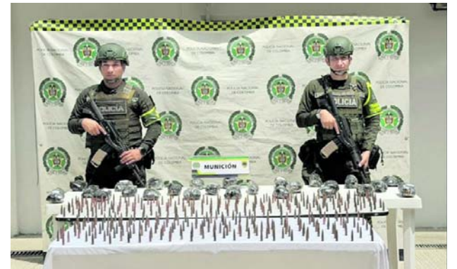
La munición fue hallada en tres paquetes ocultos entre estibas y simulados como cuadros de madera durante controles en la vía Buenaventura-Buga.

El departamento contará con un Puesto de Mando Unificado en Popayán para monitorear la jornada electoral. Más de 1 millón 75 mil ciudadanos están habilitados para votar en 818 puestos y 3.427 mesas distribuidas en los 42 municipios caucanos.