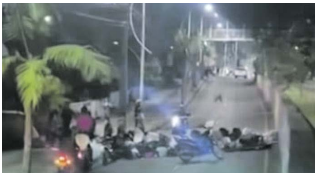
Habitantes de varios barrios de Popayán realizaron bloqueos y protestas utilizando bolsas de basura para exigir la normalización del servicio de recolección de residuos.

Los ciudadanos denunciaron fallas en la prestación del servicio cuestionaron que, aunque las autoridades municipales han anunciado garan-