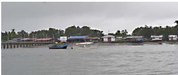
Empresarios turísticos de Buenaventura reportaron pérdidas millonarias tras la cancelación masiva de reservas por hechos de violencia y bloqueos en las vías de acceso al puerto.

queos en la vía de acceso a Buenaventura, que han afectado la movilidad hacia el distrito.