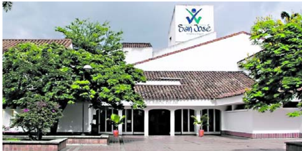
La Fundación San José de Buga suspendió la atención a usuarios de Nueva EPS, mientras hospitales del Valle del Cauca advierten una creciente crisis financiera por millonarias deudas de las EPS.

Entre tanto, las consultas, procedimientos y demás servicios programados quedaron suspendidos hasta nuevo