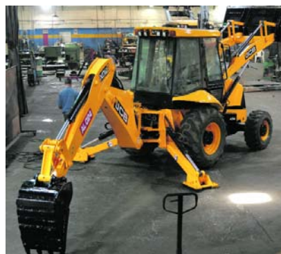
Emcali recuperó una retroexcavadora y una grúa para fortalecer su operación.

La retroexcavadora cumple funciones relacionadas con el arrastre de sólidos en