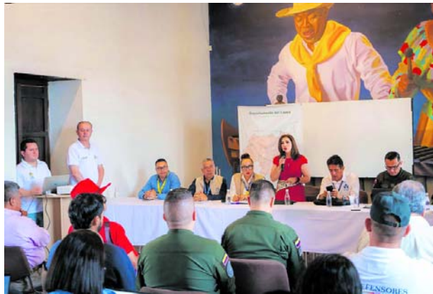
La Fuerza Pública reforzó la seguridad en Cauca para las elecciones presidenciales del 31 de mayo.

También señaló riesgos en el Catatumbo y en el Bajo Cauca antioqueño, zonas