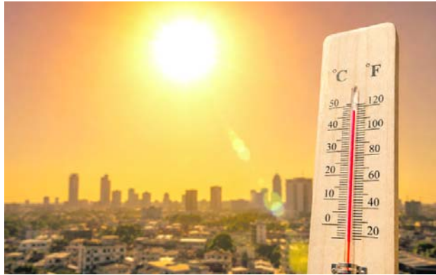
El calor extremo marcará los próximos años, según las nuevas proyecciones climáticas.

Las conclusiones se basan en un análisis realizado por 13 centros científicos internacionales y 250 simulaciones climáticas. De acuerdo con las proyecciones, la temperatura media global durante el perio-