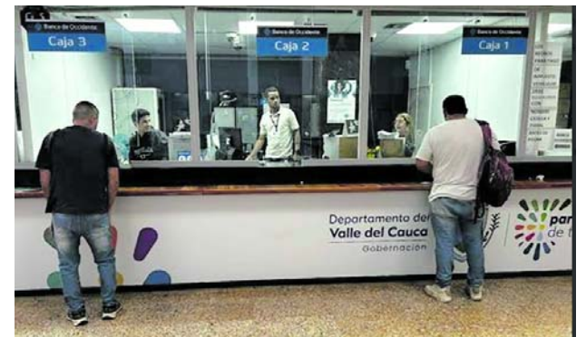
Este viernes vence plazo para pagar el impuesto automotor a los vehículos con placas entre 334 y 666.

La crisis mantiene en alerta a la red pública hospitalaria del Valle del Cauca.