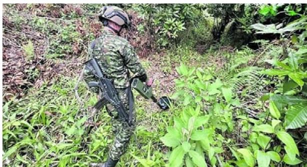
Soldados del Ejército Nacional realizaron la destrucción controlada de ocho explosivos improvisados hallados en zona rural de Caldono.

Uno de los hechos más recientes ocurrió en zona rural del municipio de Caldono, donde tropas del Batallón de Infantería Liviana N.º 7, adscrito a la Vigésima Novena Brigada, ubicaron y destruyeron ocho explosivos artesanales instalados, al parecer, por integrantes de la estructura Dagoberto Ramos Ortiz, perteneciente a las disidencias de alias