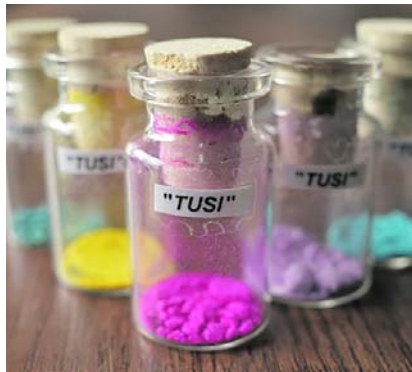
Autoridades sanitarias y expertos alertan sobre el aumento de casos graves asociados al consumo de "tusi" en Colombia.

De acuerdo con la organización Échele Cabeza, dedicada al análisis de sustancias y reducción de riesgos, en muestras analizadas en Colombia se detectó preliminarmente la presencia de xilacina, un potente