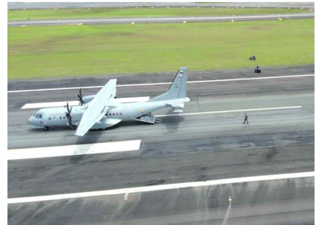
Las autoridades buscan aeronave no tripulada en Cauca

ten garantías para que los ciudadanos puedan ejercer su derecho al voto de manera libre y segura.