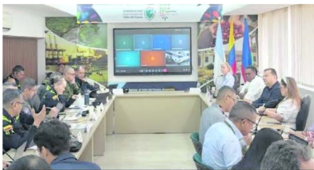
Más de 10 mil uniformados custodiarán los 1.152 puestos de votación habilitados en el Valle del Cauca durante las elecciones presidenciales del próximo domingo.