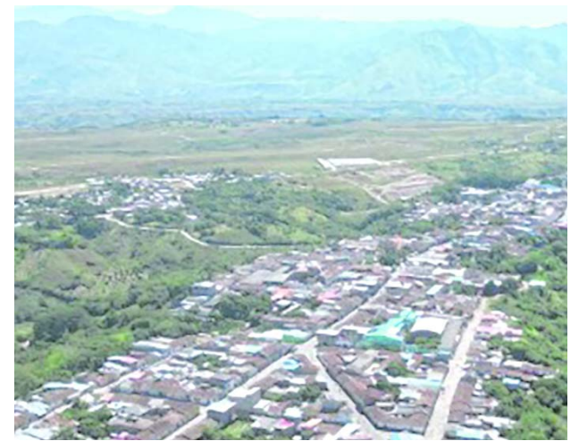
Otro firmante de paz fue asesinado en Cauca.

cación técnica y posterior destrucción controlada del material hallado en predios de comunidades indígenas de Caldono.