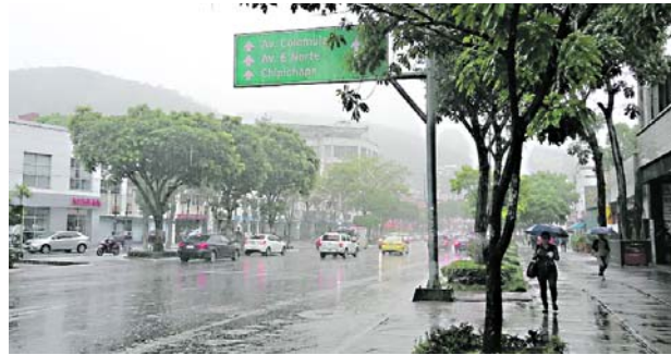
Lluvias en Valle del Cauca mantienen alertas por inundaciones y deslizamientos.

pronóstico nacional muestra precipitaciones en departamentos del Pacífico, la región Andina, sectores del Caribe y algunas áreas de la Amazonía y la Orinoquía. El Ideam señaló que las condiciones atmosféricas favorecerán acumulados importantes de agua en amplias zonas del territorio colombiano.