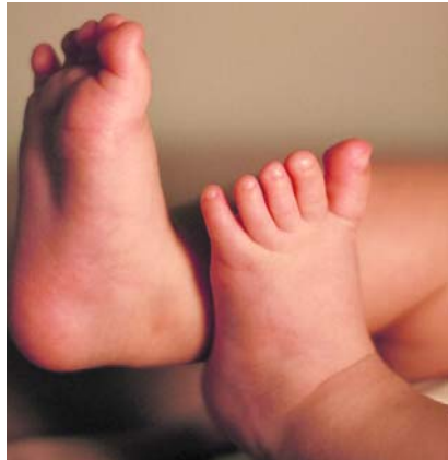
El brote se presentó en una institución educativa de Jamundí.