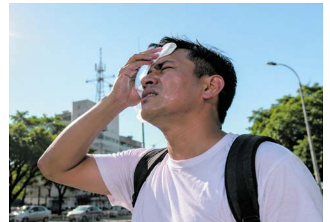
Emcali activó medidas para garantizar agua potable durante la temporada seca en Cali.