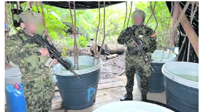
Las autoridades destruyeron un complejo cocalero en zona rural de Mosquera, Nariño.

El Ejército y la Policía hicieron un llamado a la ciudadanía para informar de manera oportuna cualquier situación sospechosa que pueda poner en riesgo la seguridad de la población o de la infraestructura pública en la región.