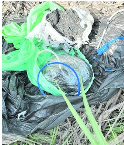
El artefacto explosivo improvisado fue hallado cerca de la base de una torre de energía en el municipio de Candelaria.

Según las autoridades, el explosivo habría sido instalado por integrantes del grupo armado organizado residual Jaime Martínez, estructura de las disidencias de las Farc señalada de operar bajo el mando de alias "Marlon" y alias "Iván Mordisco" en el suroccidente del país.