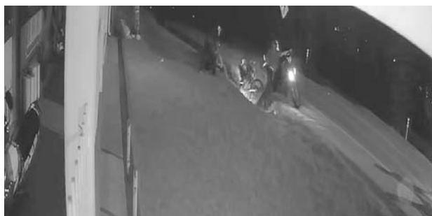
Videos de cámaras de seguridad registran varios asaltos en la vía Panamericana.

teriormente los intimidaron con armas de fuego para despojarlos de equipos de grabación, documentos personales y del vehículo en el que se movilizaban.