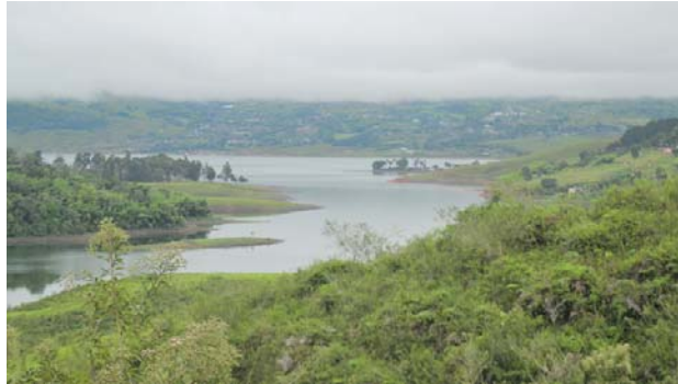
El cuerpo sin vida de un hombre fue hallado flotando en aguas del lago Calima, las autoridades investigan causas de su muerte.