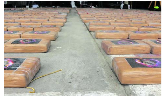
La Armada de Colombia intensificó las operaciones de interdicción marítima en el Pacífico, logrando la incautación de más de dos toneladas de cocaína en acciones desarrolladas cerca de Buenaventura y Bahía Solano.

Las autoridades hicieron un llamado a la ciudadanía para suministrar cualquier información que contribuya al esclarecimiento de este caso.