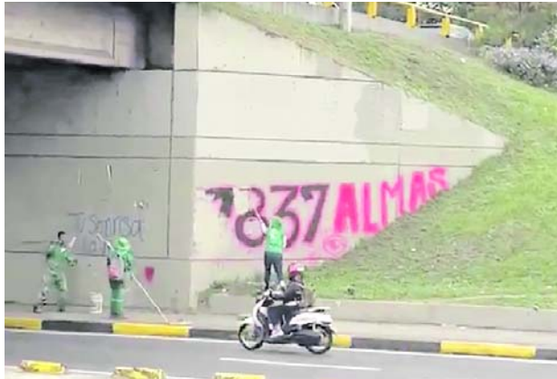
Mural sobre falsos positivos en Cali fue cubierto tras polémica.