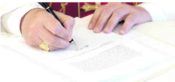
León XIV presentó "Magnifica Humanitas" sobre inteligencia artificial y doctrina social.

trado en manos de pocos actores privados.