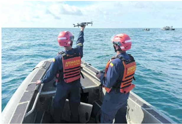
Más de 70 unidades marítimas, terrestres, fluviales y aeronavales fueron dispuestas por la Armada para reforzar la seguridad durante las elecciones presidenciales en el Pacífico colombiano.

el despliegue incluirá 12 unidades marítimas, 26 terrestres, más de 30 fluviales y cuatro aeronavales, encargadas de realizar patrullajes permanentes, control de área y acompañamiento a la población civil durante los