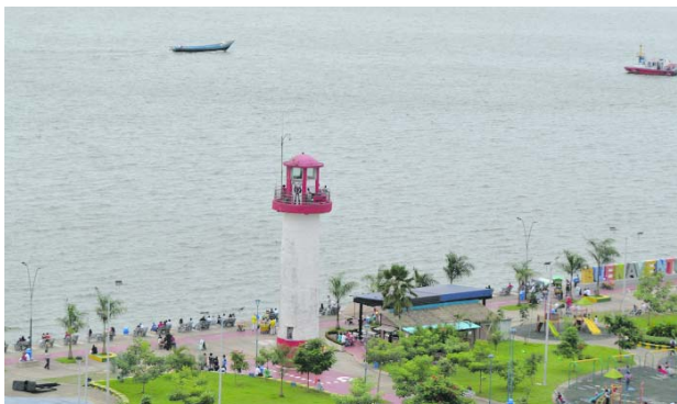
Empresarios turísticos de Buenaventura reportan cancelaciones de reservas tras el secuestro y asesinato ocurrido en La Bocana.

La situación ha provocado preocupación entre empresar-