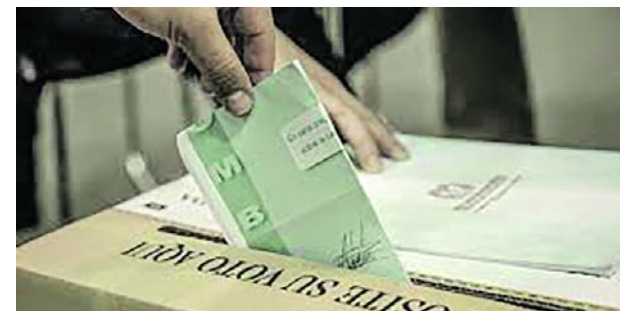
Colombianos en el exterior participan en las elecciones presidenciales de Colombia 2026.

Como parte del operativo de seguridad, la Alcaldía de Cali expedirá el decreto de Ley Seca para el fin de semana electoral. La medida prohibirá el expendio y consumo de bebidas alcohólicas.