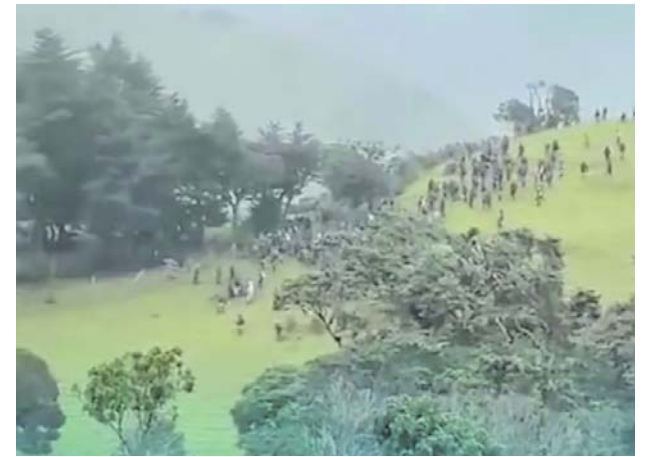
Comunidades indígenas Misak y Nasa mantienen la tensión en Silvia, Cauca, mientras niegan acuerdos definitivos y rechazan señalamientos sobre presuntas infiltraciones armadas.

Las autoridades civiles y militares activarán Puestos de Mando Unificado para monitorear la jornada.