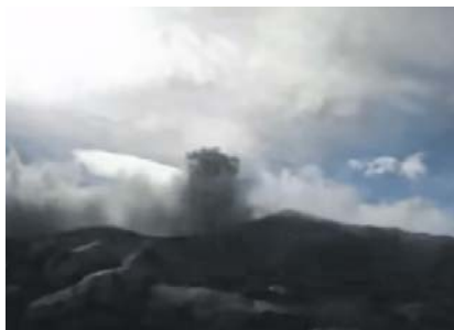
La ceniza del volcán Puracé se dispersó hacia varios sectores del Cauca, incluida parte de la ciudad de Popayán.

El Servicio Geológico Colombiano informó que durante mayo se han presen-