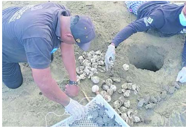
Guardianes comunitarios y funcionarios de Codechocó realizan monitoreo y toma de datos científicos a tortugas marinas durante la temporada de anidación en el Playón de Acandí, en el Golfo del Darién.

Con esta expansión, el área protegida adopta el nombre de Santuario de Fauna y Flora Acandí, Playón, Playona, San Francisco y Cabo Tiburón. El territorio alberga arrecifes de coral, manglares, pastos marinos e islotes que sirven de refugio para múltiples especies marinas y costeras.