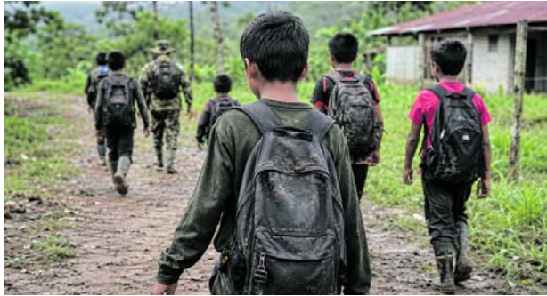
La Defensoría reportó 386 casos de reclutamiento de menores en Colombia durante 2025.

Según el balance oficial, el 60 % de las víctimas corresponde a niños y adolescentes, mientras el 40 % afecta a niñas y adolescentes.