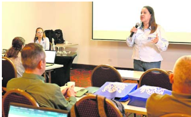
Autoridades ambientales y judiciales unen esfuerzos contra el tráfico de fauna silvestre.

En Colombia, uno de los países más biodiversos del planeta, las consecuencias son alarmantes: el 70 % de los animales traficados muere antes de llegar a su destino y apenas el 8 % de los casos termina en una sentencia condenatoria.