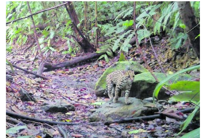
Las cámaras trampa de la Red OTUS registraron en Buenaventura cinco especies de felinos silvestres, entre ellas jaguar, puma y ocelote, en ecosistemas del Pacífico vallecaucano.

La entidad reportó 188 arribos de hembras anidadoras, 73 atenciones morfológicas y el nacimiento de 216 neonatos que lograron llegar al mar.