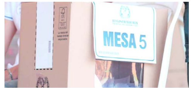
Asocapitales alertó sobre riesgos electorales urbanos antes de las elecciones presidenciales de 2026.

La entidad reiteró la necesidad de fortalecer las acciones de prevención y protección para niños, niñas y adolescentes en zonas afectadas.