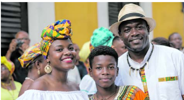
Población afrocolombiana en Cali enfrenta brechas en empleo, vivienda y seguridad.

Además, Cali A.M. concentra el 13,2 % de la población afrocolombiana del país, una de las cifras más altas registradas en ciudades colombianas.