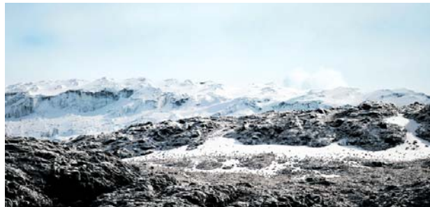
Entidades nacionales, autoridades ambientales y gobiernos regionales firmaron la alianza que impulsa la creación del primer Geoparque Mundial UNESCO de Colombia en la ecorregión del Eje Cafetero.

Parques Nacionales Naturales de Colombia, la RAP Eje Cafetero, las gobernaciones de Tolima, Caldas, Quindío y Risaralda, además de las corporaciones autónomas regionales y el Servicio Geológico Colombiano.