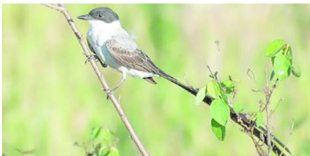
La Reserva Natural San Cipriano y la Laguna de Sonso estuvieron entre los lugares del Valle del Cauca con mayor número de especies registradas durante el Global Big Day 2026.

Esta diversidad incluye especies residentes, migratorias y endémicas que encuen-