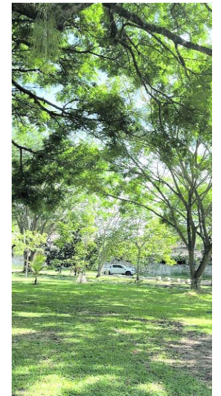
Cerca de 200 representantes de alcaldías, empresas y operadores se reunieron para fortalecer la implementación de la Ley de Areas de 2173 de 2021 en el Valle del Cauca.

Según la Corporación Autónoma Regional del Valle del Cauca, municipios como Bolívar, La Unión, Vijes y Yumbo, equivalentes al 11,1 % de los entes territoriales evaluados, ya cumplieron satisfactoriamente con la delimitación y publicación de