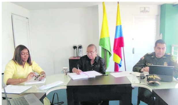
Las autoridades de Buenaventura analizaron la situación de seguridad de esta ciudad portuaria.

“El mes de abril de 2026 fue satisfactorio porque, aunque se presentaron seis homicidios, frente a los nueve registrados en abril de 2025, se evi-