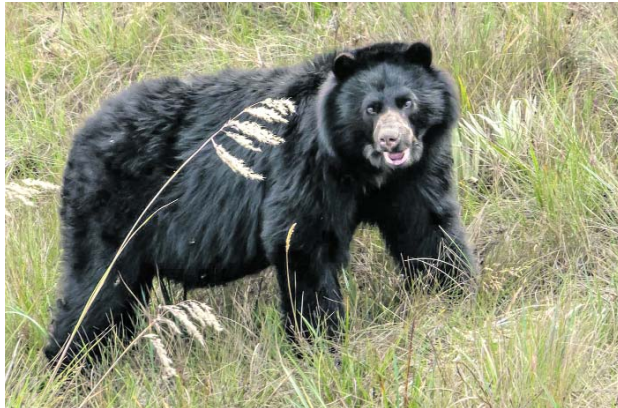
Los osos andinos también han sido avistados en las cámaras trampa de la Red Otus.

La alianza está integrada por la CVC, Parques