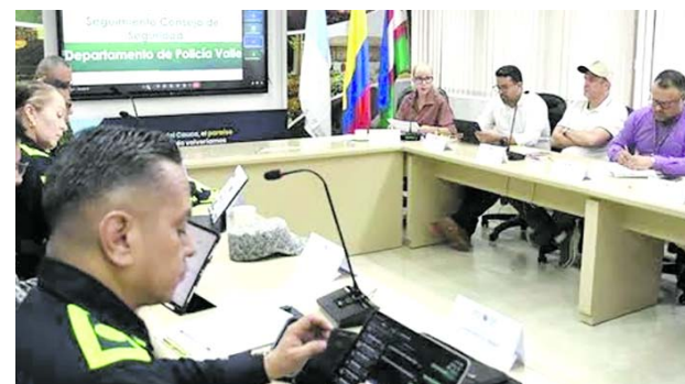
Autoridades del Valle del Cauca anunciaron nuevas estrategias de seguridad para enfrentar los ataques en Jamundí y avanzar en la investigación del doble homicidio ocurrido en Calima El Darién.