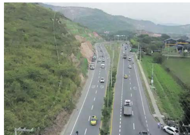
Miles de familias en el Valle del Cauca han sido afectadas por desplazamientos, confinamientos y violencia derivada del conflicto armado.

Como medida preventiva, la Institución Educativa San Antonio anunció mediante un comunicado la suspensión de las clases presenciales en sus sedes del corregimiento y ordenó continuar las activi-