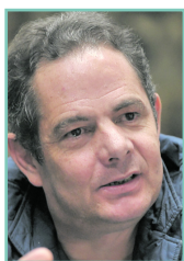
Germán Vargas Lleras

La muerte del exvicepresidente Germán Vargas Lleras abrió un enorme signo de interrogación sobre el futuro de Cambio Radical, el partido que dirigió durante 24 años y que, en la práctica, giró alrededor de su figura.