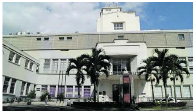
Hay alerta en la región por la sobreocupación del HUV que ya superó el 300% en Urgencias y Hospitalización.

tal público para continuar tratamientos y procedimientos que dejaron de recibir en otras instituciones.