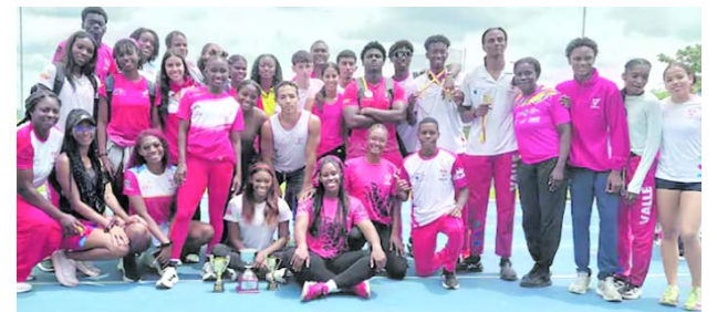
La selección vallecaucana de atletismo sub-23 lideró el medallero nacional en Armenia y confirmó el gran momento deportivo del Valle del Cauca.

La entidad también fortaleció el monitoreo científico y comunitario mediante la red Otus, que cuenta con 240 cámaras trampa en el Valle del Cauca. Precisamente, uno de estos dispositivos registró recientemente a un joven macho de oso andino en el corredor biológico Chilibarragán, en la cuenca del río Bugalagrande.