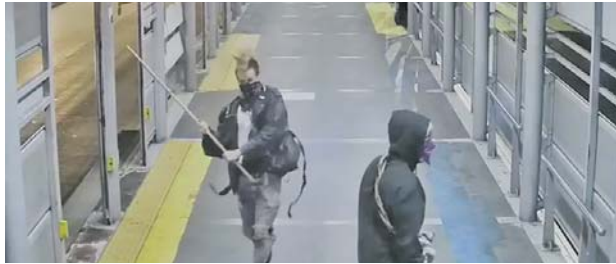
Autoridades capturaron a un señalado participante en vandalismo en el MIO.

El presidente de Metro Cali, Álvaro Rengifo, señaló que Cali necesita sanciones que envíen un mensaje claro frente a los ataques contra la