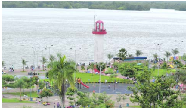
La Gobernación del Valle y la Personería de Buenaventura pidieron medidas urgentes para proteger a niñas, niños y adolescentes frente a la violencia y el reclutamiento por parte de bandas criminales.

La mandataria aseguró que, aunque considera importante la firma de este tipo de pactos, existe preocupación por el incumplimiento de acuerdos anteriores. “Muchas veces se hacen los pactos, pero no se cumplen”, afirmó, al insistir en que se deben establecer controles claros para garanti-