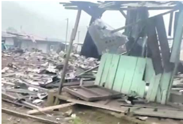
La explosión ocurrió en una vivienda de la vereda La Hacienda, en zona rural de El Plateado, donde presuntamente eran acondicionadas motocicletas con explosivos para futuros atentados.

De acuerdo con la Tercera División del Ejército, la detonación ocurrió cuando presuntos integrantes del frente Carlos Patiño, estructura armada ilegal de las disidencias de las Farc, manipulaban explosivos y acondicionaban motocicletas con cargas explosivas en una vivienda del sector.