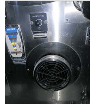
Bomberos Cali alertó por el hurto de piezas de sus máquinas extintoras.

Además, Bomberos Cali señaló que este tipo de piezas no tiene utilidad práctica fuera de las labores bomberiles. Tampoco representa un beneficio funcional para quienes intenten adquirirlas o comercializarlas de manera ilegal. Sin embargo, la ausencia de estos implementos sí puede generar retrasos durante procedimientos que