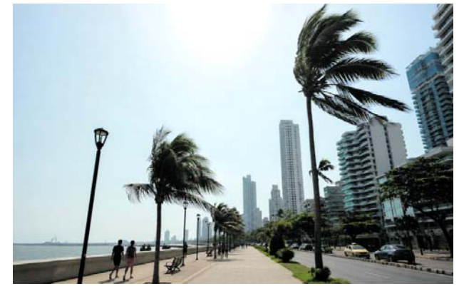
Altas temperaturas en Colombia generan alertas por incendios forestales.

La Policía señaló que entre las víctimas había bebés de 10 meses de nacidos y menores entre 1 y 12 años de edad.