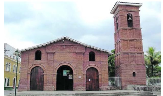
Las autoridades reportan seis ataques con drones y 15 granadas lanzadas contra tropas del Ejército en la zona rural de Jamundí durante las últimas semanas.

Potes advirtió que esta situación incrementa el temor de docentes y padres de familia frente a posibles casos de reclutamiento forzado o instrumentalización de estudiantes.