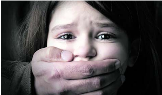
Capturan a 10 personas por red de explotación sexual infantil en Colombia.

Durante las acciones judiciales fueron capturadas diez personas señaladas de partici-