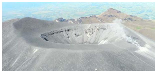
La emisión de ceniza del volcán Puracé ha sido reportada en zonas rurales del Cauca y en la ciudad de Popayán, mientras las autoridades mantienen la alerta amarilla y el monitoreo constante del sistema volcánico.

Según el Observatorio Vulcanológico y Sismológico de Popayán, las emisiones de ceniza han sido reportadas en sectores como la vereda