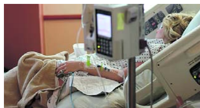
Contraloría alerta sobre riesgos financieros y fallas en EPS intervenidas.

La advertencia incluye a Coosalud, Famisanar, Capresoca, Savia Salud, As-