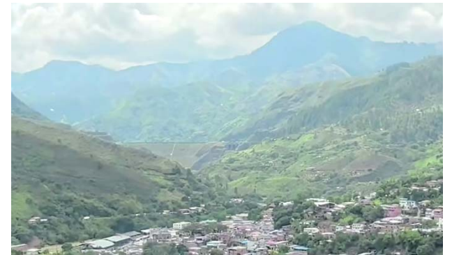
Los recientes ataques con explosivos y drones contra la Fuerza Pública en Suárez obligaron a las autoridades locales a suspender actividades institucionales y pedir protección para la población civil.

La explosión ocurrió en medio de la Operación Perseo, ofensiva militar desplegada en el Cañón del Micay para combatir al frente Carlos Patiño, señalado de realizar ataques.