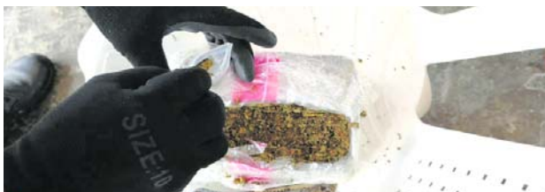
La Armada de Colombia incautó en aguas del Pacífico colombiano estupefacientes valorados en 62 millones de dólares.

Los procedimientos se llevaron a cabo gracias a información suministrada por Inteligencia Naval, que alertaba sobre la presencia de dos