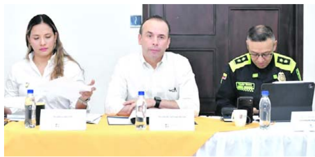
Cali reportó reducción de homicidios durante el fin de semana del Día de la Madre.

las autoridades y fortalecer las investigaciones.