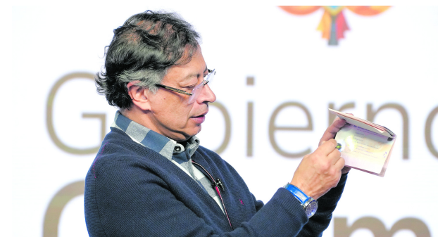
Nuevo modelo de pasaportes en Colombia inició su implementación progresiva desde el 1 de abril.

Desde entonces, el debate se ha centrado en la transición hacia un nuevo esquema liderado por entidades estatales, en particular la Imprenta Nacional, frente a un modelo que durante décadas estuvo en manos de un proveedor privado. Mientras el Gobierno defendió la necesidad de recuperar capacidades productivas y reducir la dependencia externa, sectores políticos, expertos y usuarios expresaron preocupación por la estabilidad del servicio, los tiempos de implementación y el impacto que podría tener el cambio en la expedición de pasaportes en el país.