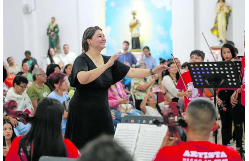
Niños y jóvenes de Siloé emocionaron al público durante concierto en la parroquia de San Cayetano.

La Orquesta Sinfónica Infantil y Juvenil de Siloé emocionó a los asistentes en la parroquia de San Cayetano durante el II Festival de Música Clásica de Cali, que se realiza en Semana Santa hasta el 5 de abril.