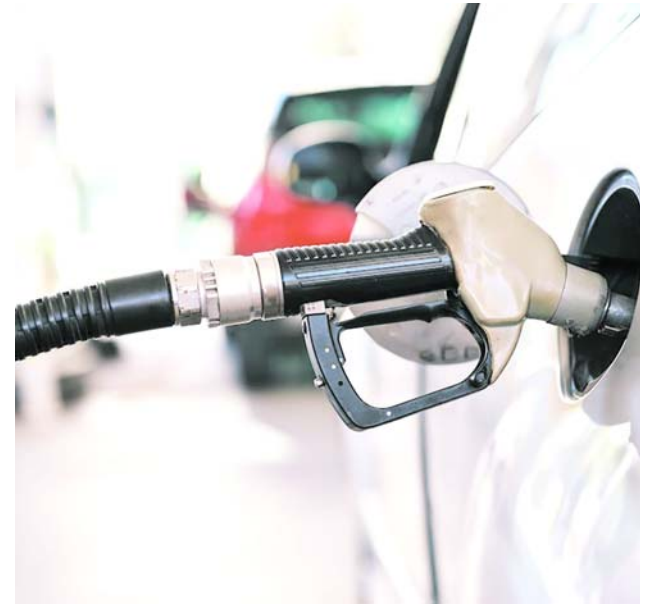
El precio de la gasolina en Colombia volvió a subir desde el 1 de abril tras dos reducciones previas.

Este escenario también presiona las finanzas del Fondo de Estabilización de Precios de los Combustibles, que busca amortiguar el impacto de las variaciones internacionales en el mercado local.