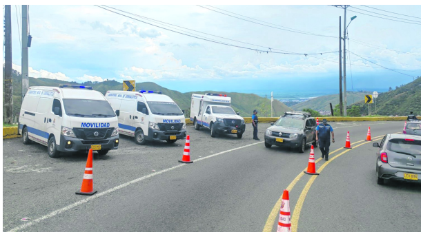
Ingreso a Cali tendrá restricciones por placas el domingo 5 de abril durante el plan retorno.