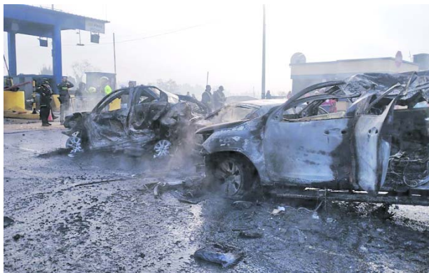
Accidente en peaje Casa Blanca dejó cinco muertos y más de 20 heridos en Cundinamarca.

Uno de los heridos permanece en estado crítico y fue trasladado desde el