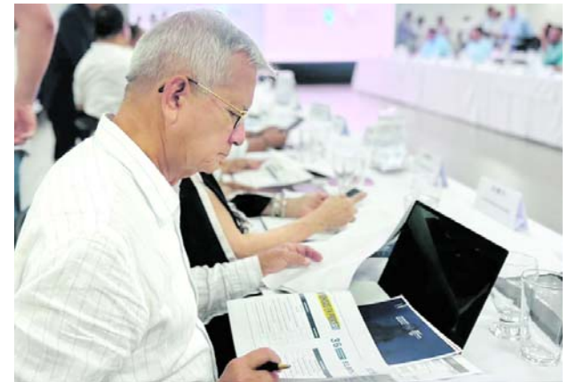
Autoridades departamentales y de Palmira evaluaron avances de proyectos estratégicos.

Gremios y autoridades han solicitado al Gobierno medidas urgentes, incluida la militarización de la vía.