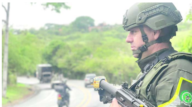
Patrullajes conjuntos entre Policía y Ejército refuerzan la seguridad en corredores viales del Valle del Cauca tras recientes ataques.