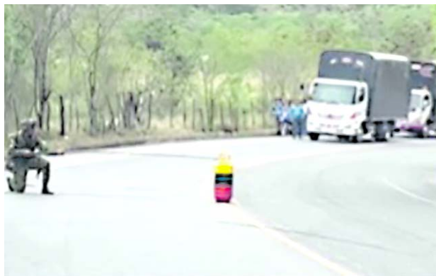
Soldados del Ejército realizaron la destrucción controlada de los explosivos hallados en la vía Panamericana, en Taminango, Nariño.

Los uniformados realizaron labores de verificación en el corregimiento de El Remolino, donde ubicaron los dispositivos y activaron protocolos de seguridad para neu-