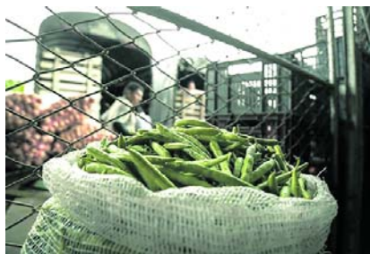
Retrasos en el transporte de alimentos y combustible por la vía Panamericana generan presión en los precios y riesgo de desabastecimiento en el suroccidente.

Pese a las dificultades, las centrales reportan niveles de abastecimiento cercanos a lo proyectado, aunque advierten que el comportamiento de los precios seguirá condicionado por factores logísti-