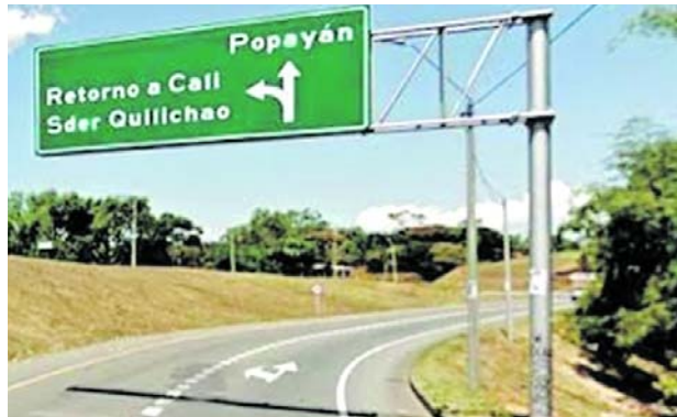
Los transportadores temen movilizarse por la vía Panamericana ante el aumento de ataques y la falta de condiciones de seguridad.

Según el gremio, los hechos violentos son constantes y afectan tanto a los vehículos