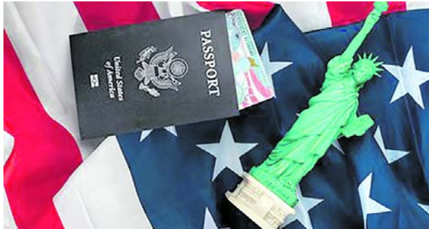
Visa americana enfrenta nuevas reglas en entrevistas consulares para solicitantes temporales

Una nueva medida sobre la visa americana entró en vigor el 28 de abril de 2026 y modifica el proceso para turistas, estudiantes y otros solicitantes de visas temporales. El Departamento de Estado ordenó negar solicitudes a quienes expresen temor de regresar a su país de origen durante la entrevista consular.