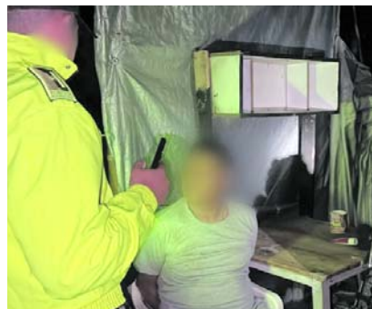
Captura alias Mi Pez por atentados en Cali y Cajibío.

En ese contexto, las investigaciones señalan que la estructura de las disidencias de las Farc 'Dagoberto Ramos' estaría