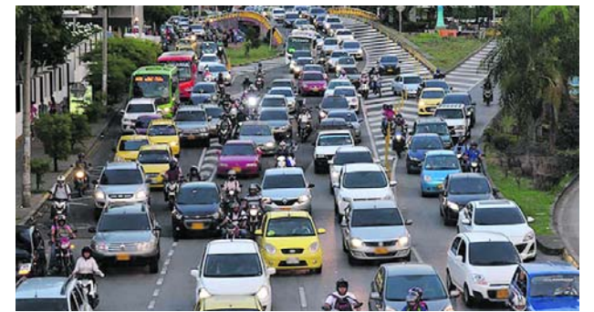
Congestión vehicular en Cali según TomTom Traffic Index 2025.

Según las autoridades, el capturado acumula más de 20 años de trayectoria en organizaciones ilegales. Además, lo identifican como un hombre cercano al círculo de alias "Iván Mordisco".