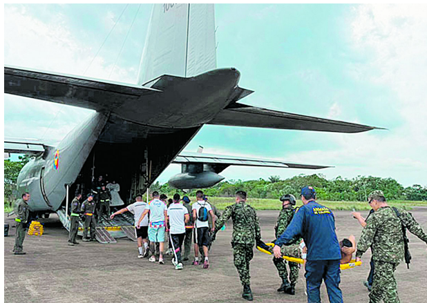
Aeronaves sin seguro en la FAC, según Comunicado 006 tras accidente del Hércules.

En ese sentido, la institución explicó en el comunicado que, con los recursos disponibles, se priorizó el aseguramiento de una parte de la flota. Por ello, varias aeronaves quedaron por fuera del