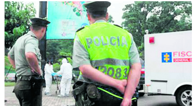
Homicidios en Cali generan debate y nuevas medidas de seguridad.