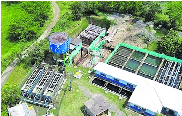
Acuavalle anunció su vinculación a la Red Mundial de Empresas de Agua.

Con esta alianza Acuavalle consolida su crecimiento y estabilidad administrativa, operativa y financiera siendo reconocida entre las empresas líderes en el ámbito mundial para hacer parte de este ambicioso objetivo que responde a su vez, a las metas establecidas para el cumplimiento de los