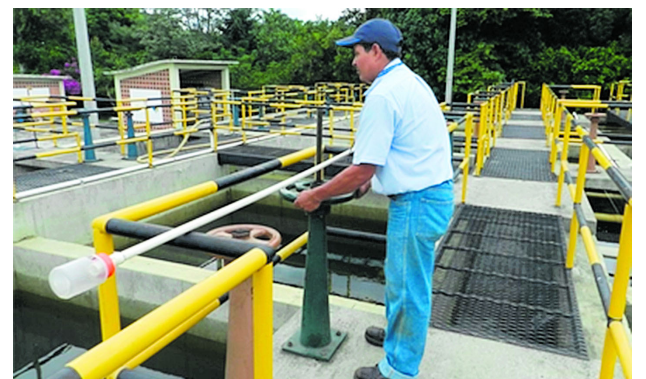
Acuavalle avanzará este 2026 con proyectos que buscan fortalecer los acueductos y proteger los recursos hídricos.

Dicho reservorio estará ubicado en el municipio de Pradera.