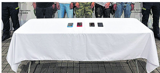
Capturas por microtráfico en el Bulevar del Río en Cali.

La acción se desarrolló luego de dos meses de investi-