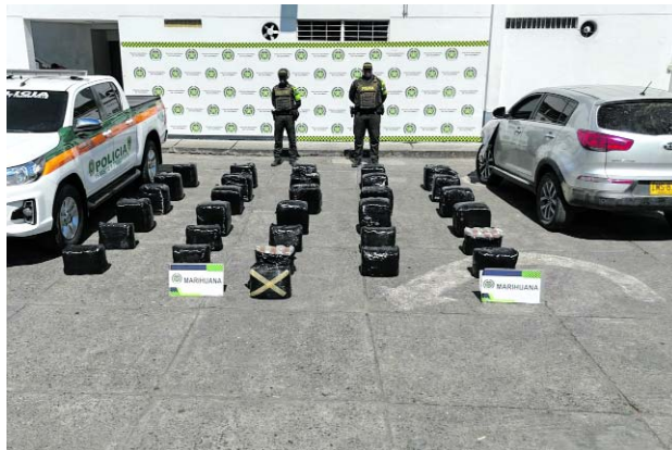
Vehículo y marihuana fueron incautados por las autoridades en la vía Tuluá-Andalucía.