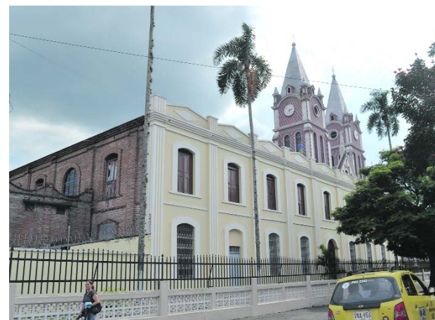
El comercio de Tuluá se encuentra preocupado por las intimidaciones de los delincuentes.

Los organismos de investigación trabajan para conocer la identidad y capturar a la persona que conducía dicho vehículos.