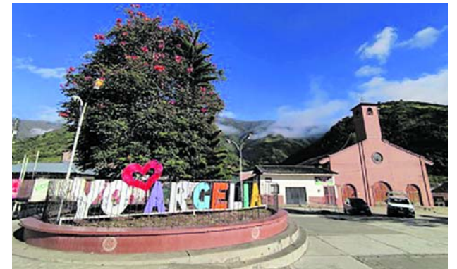
Los operativos contra los grupos ilegales se mantienen en el Cauca.

Así mismo, destacó entre las conclusiones del preforo que "se demuestra que Colombia es un país de enorme riqueza natural y la COP es muy importante de reconocimiento a la biodiversidad de Colombia".