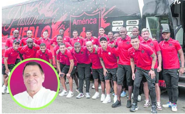
América de Cali anunció la cancelación de su posible asociación con el grupo Caltac debido a presuntas irregularidades encontradas.

promiso del América de Cali con la transparencia y la integridad en todas sus operaciones. El club subraya que todas las asociaciones y vinculaciones con terceros deben cumplir con sus estrictos lineamientos internos, así como con las regulaciones establecidas por las entidades de con-