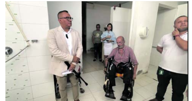
Filtraciones y humedades en el Hospital Geriátrico San Miguel ponen en riesgo la salud de los residentes