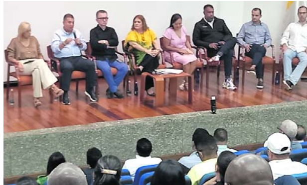
Las corporaciones ambientales se reunieron en Cali en el preforo "Biodiversidad: desafíos y oportunidades de conservación desde el territorio hacia los compromisos globales de la COP16".

la presencia de más de 600 negocios verdes que vendrán de las diferentes regiones del país en un esfuerzo de todas las corporaciones. Recordemos que los negocios verdes son la manera más eficaz de proteger nuestros recursos naturales, pero al mismo tiempo producir de una manera adecuada y