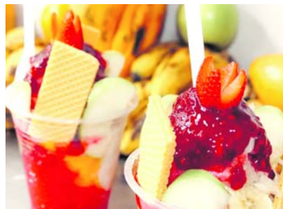
Los sabores de la región están presentes en la Ruta del Postre Acodrés 2024.