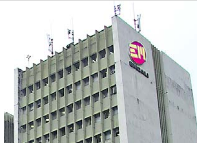
Procuraduría investiga presunto 'megarrobo' de energía en EMCALI, con pérdidas estimadas en $50 mil millones mensuales

Para llevar a cabo la investigación, el equipo de la Procuraduría, con el apoyo de la directora nacional de Investigaciones Especiales, Lucila Vidal, pasó dos días en las oficinas de EMCALI recabando documentos y evidencias clave. La recopilación de esta información es crucial para identificar a los responsables y proceder con las sanciones correspondientes. Según los hallazgos preliminares, los involucrados habrían cobrado cuotas mensuales de