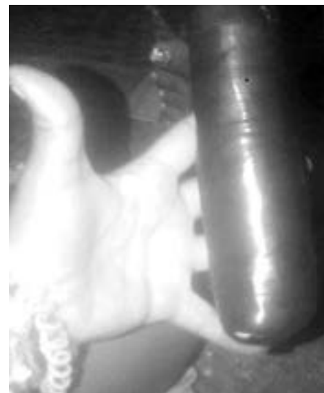
Los "dedos" que digiere una de las mulas del centro penitenciario para evadir la guardia.

Sigilosamente fue ascendiendo, hasta el patio indicado. Por esa 'vuelta', como ella misma la llama, le pagaron 500 mil pesos.