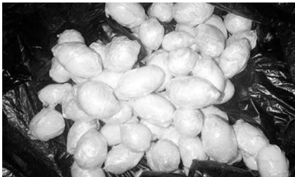
armen muestra uno de los "huevos" que introduce en sus partes íntimas.

Después apareció una piola con una funda de almohada, que fue lanzada de uno de los patios y que sirvió de ascensor para hacer desaparecer el encargo.