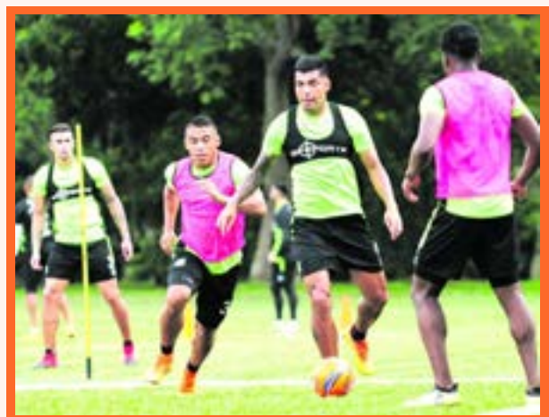
Deportivo Cali recibirá el próximo jueves al Independiente Medellín.