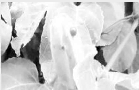
El virus que afecta el maracuyá ataca directamente sus hojas.

La secretaria dijo que apenas son diez hectáreas afectadas pero dada la importancia del maracuyá en el departamento que aporta el 17% de la producción nacional de