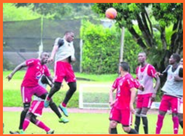
Los dirigidos por Hernán Torres se ponen a punto para el duelo de este miércoles.