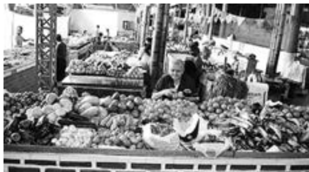
En el Valle del Cauca se trabaja por evitar la propagación de plagas en los cultivos.

"Ya se ha hecho un mejor control de plagas sobre todo con entidades como el ICA y del sector sanitario. Afortunadamente en el Valle tenemos centros de investigación que nos ayudan mucho en evitar la propagación de estas enfermedades".