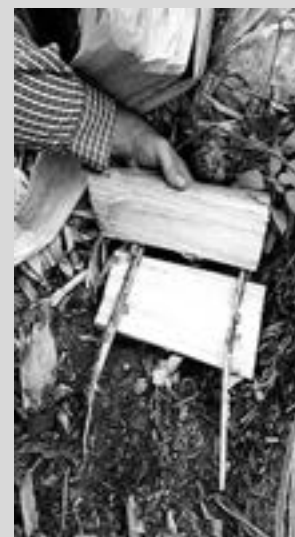
Con feromonas de insectos se puede combatir el plátano.

Estas feromonas son importadas de Costa Rica, y son comercialmente conocidas con los nombres de Metalure y Cosmolure, que atraen machos y hembras de M. hemipterus y de C.