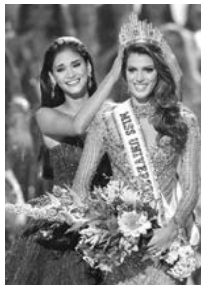
Iris Mittenaere, de 24 años, es la nueva Miss Universo.