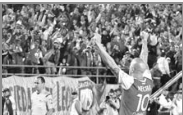
Independiente Santa Fe ganó su tercera Superliga.