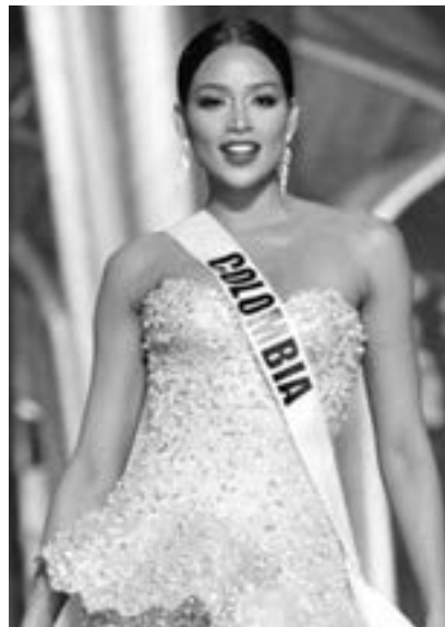
La chocoana de 23 años, estudiante de Diseño Industrial, terminó tercera.