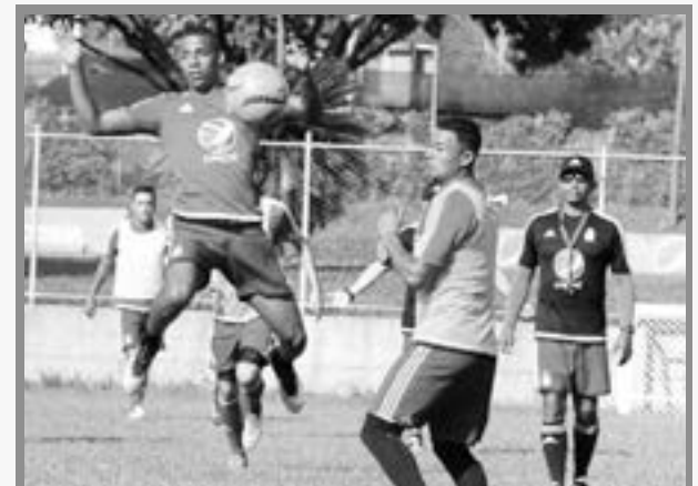
América tendrá esta semana para alistar su regreso a la Primera División.

Los compromisos amistosos entre los equipos de América y Patriotas fueron suspendidos por la presencia no autorizada de las barras del cuadro rojo en el lugar donde se cumplían los juegos, en la ciudad de Bogotá.