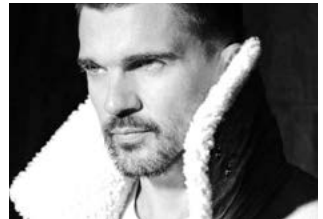
El músico antioqueño Juanes estrena Hermosa ingrata