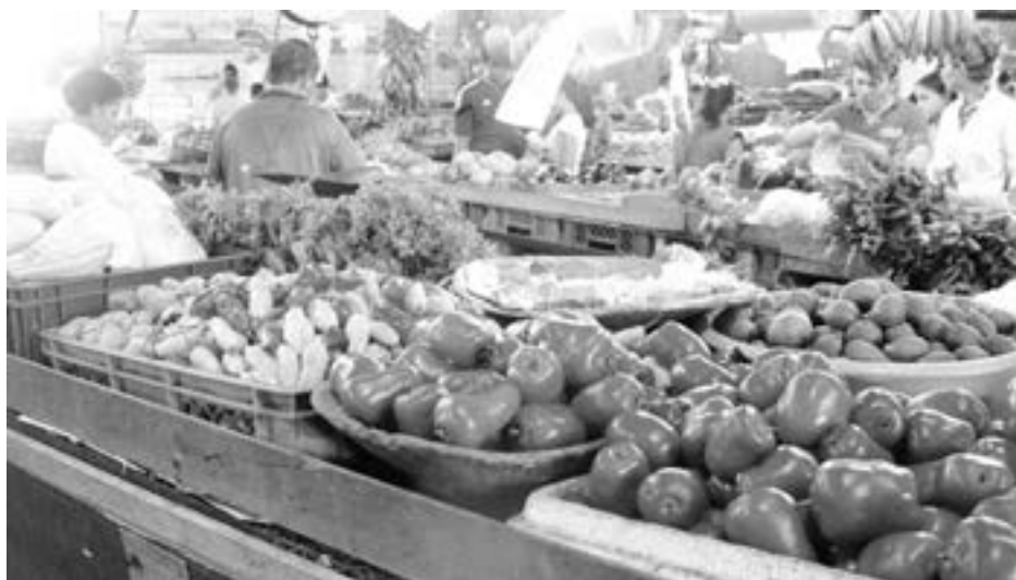
Los compradores no se quedan con las ganas de pedir la ñapa.

"Un lugar que huele a flores y plantas recién cortadas, los olores de las frutas maduras provocan el deseo de probarlas una a una".