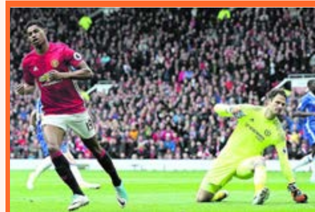
El conjunto de Mourinho sumó 22 partidos sin perder en el rentado local.

Manchester United sacó lo mejor de su fútbol en Old Trafford para superar al Chelsea por 2-0 en la fecha 33 de la Premier League.