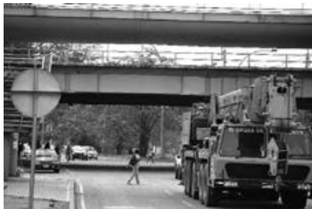
El puente peatonal de la Calle 70 con Carrera 1 es el menos utilizado por los peatones.

Por su parte, James Gómez, experto en movilidad, aseguró que los puentes peatonales no son la solución a la movilidad de los ciudadanos: “hoy en el mundo se