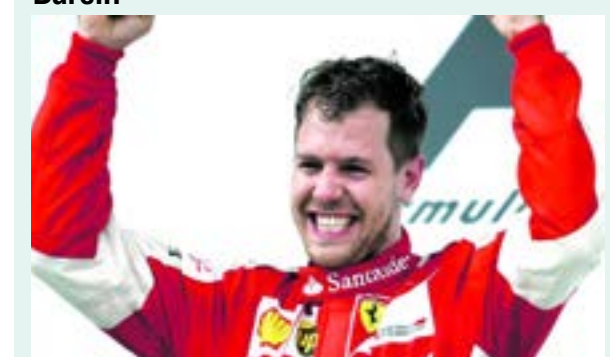
Victoria de Vettel en el Gran Premio de Baréin

El campeón del mundo Sebastian Vettel logró su segunda victoria de la presente temporada en el Mundial de Fórmula Uno, del que ahora es líder en solitario, al ganar el Gran Premio de Baréin, por delante de los dos pilotos de Mercedes, el británico Lewis Hamilton y el finlandés Valtteri Bottas. Vettel lidera el Mundial de pilotos con 68 puntos, siete más que Hamilton, con el que estaba empatado a 43 antes de empezar la tercera carrera de la temporada. Bottas se coloca tercero con 38.