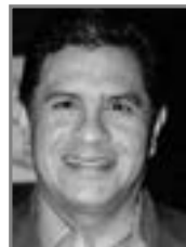
Jorge Iván Ospina

Ospina, pues el primero era el candidato de la Alianza Verde a la Alcaldía de Cali, y el segundo encabezó el grupo de los verdes que respaldaron al candidato del Partido de la U a la Alcaldía de Cali.