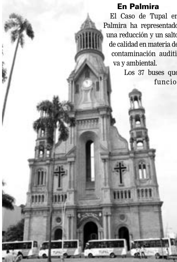
Especial Diario Occidente

La experiencia de Tupal en Palmira ha sido una de las más importantes en el mercado del gas natural vehicular.