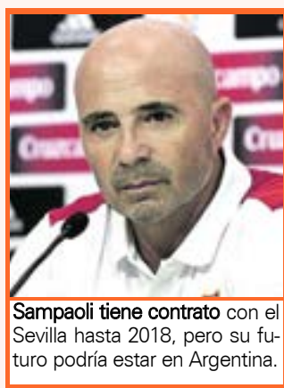
Sampaoli tiene contrato con el Sevilla hasta 2018, pero su futuro podría estar en Argentina.