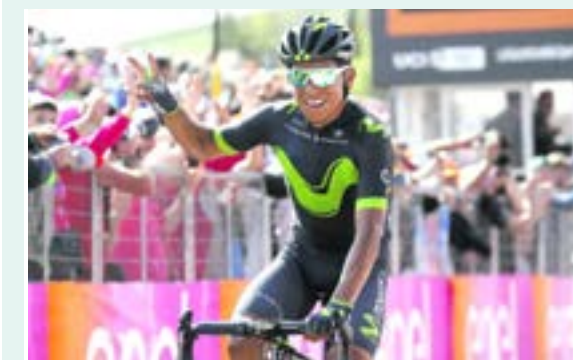
Nairo Quintana dio un golpe de autoridad y se quedó con la novena etapa del Giro de Italia.