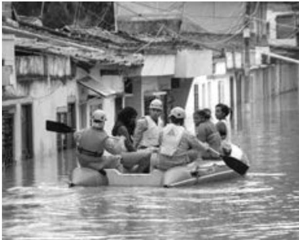
En Cali el sector de Puerto Nuevo es uno de los más afectados por las inundaciones.