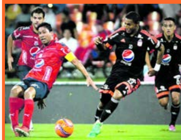
Un clásico vibrante regalaron los equipos rojos en el Atanasio Girardot.

"Tuvimos opciones claras para meter dos goles más. Pudimos haber liquidado el partido con un 3-1, pero no la metimos. Medellín también tuvo sus opciones, pero nosotros con los contragolpes de Lucumí y Borja, la tuvimos para liquidar. Si lo hacíamos no tendríamos los inconvenientes que tuvimos al final.