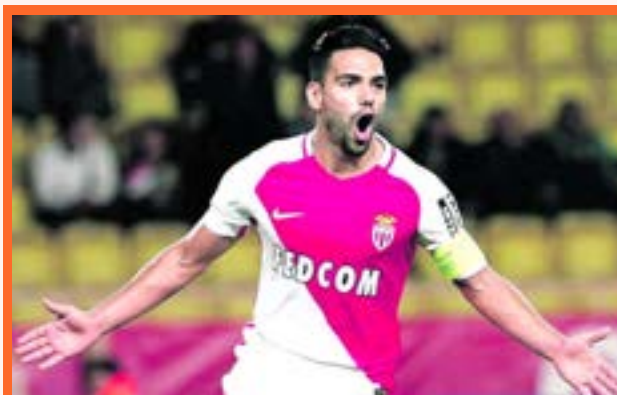
El equipo del Principado espera la próxima fecha para oficializar su título en la Liga de Francia.

Con el colombiano Radamel Falcao García como una de sus figuras, el Mónaco es el virtual campeón de la Liga de Francia. El cuadro del Principado goleó ayer 4-0 al Lille y espera el próximo juego para ratificar su corona.