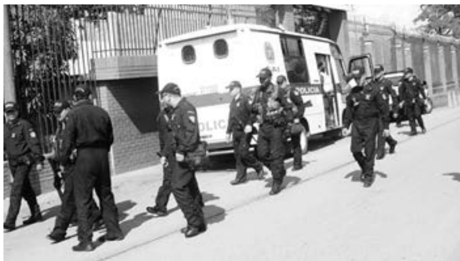
Porte ilegal de armas, hurto en todas sus modalidades, homicidio y tentativa de homicidio son los delitos en los que más incurren los adolescentes en Cali.

"La finalidad para los adultos es resocializadora y