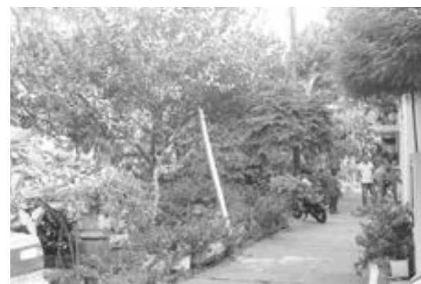
Los vecinos disfrutaban esta esquina, creada con mucha armonía natural.