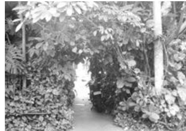
Para caminar por el andén, hay que pasar por debajo de una unión de ramas

Además de esto también tienen algo en común: En algún momento, sus vecinos recogieron firmas para ponerle fin a sus propuestas ecológicas, con exactamente las mismas tres razones; los insectos, los animales y los consumidores de estupefacientes. Sin embargo, el Dagma siempre les ha brindado protección y apoyo a ambos, les fue otorgada la adopción del espacio público y periódicamente un funcionario verifica el estado del mismo.