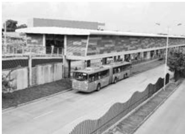
Los sistemas integrados de transporte requieren una planificación a largo plazo.